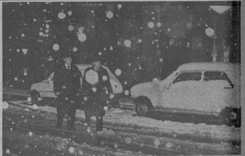
Buena nevada la de anoche, cuando ya la primavera se nos aproxima. Despedida del invierno que no quiere dejarnos sin alguna reserva de agua en la sierra y sin un buen "riego" para los campos. En la foto, una de nuestras calles en un momento de la nevada.

EL ARZOBISPO DE RECIFE , monseñor Helder Camara, brasileño, a quien Pablo VI calificó de "obispo comunista, se encuentra hoy en París, en donde celebrará un ciclo de conferencias sobre las desigualdades entre países pobres y ricos.