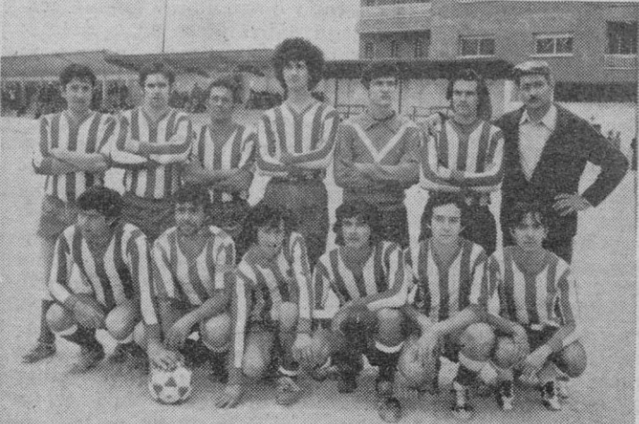
Dos equipos de los que actúan en el campeonato de fútbol de la campaña «Deporte para Todos»: Arriba, el Caballo Blanco; abajo, la Peña del At. de Madrid.