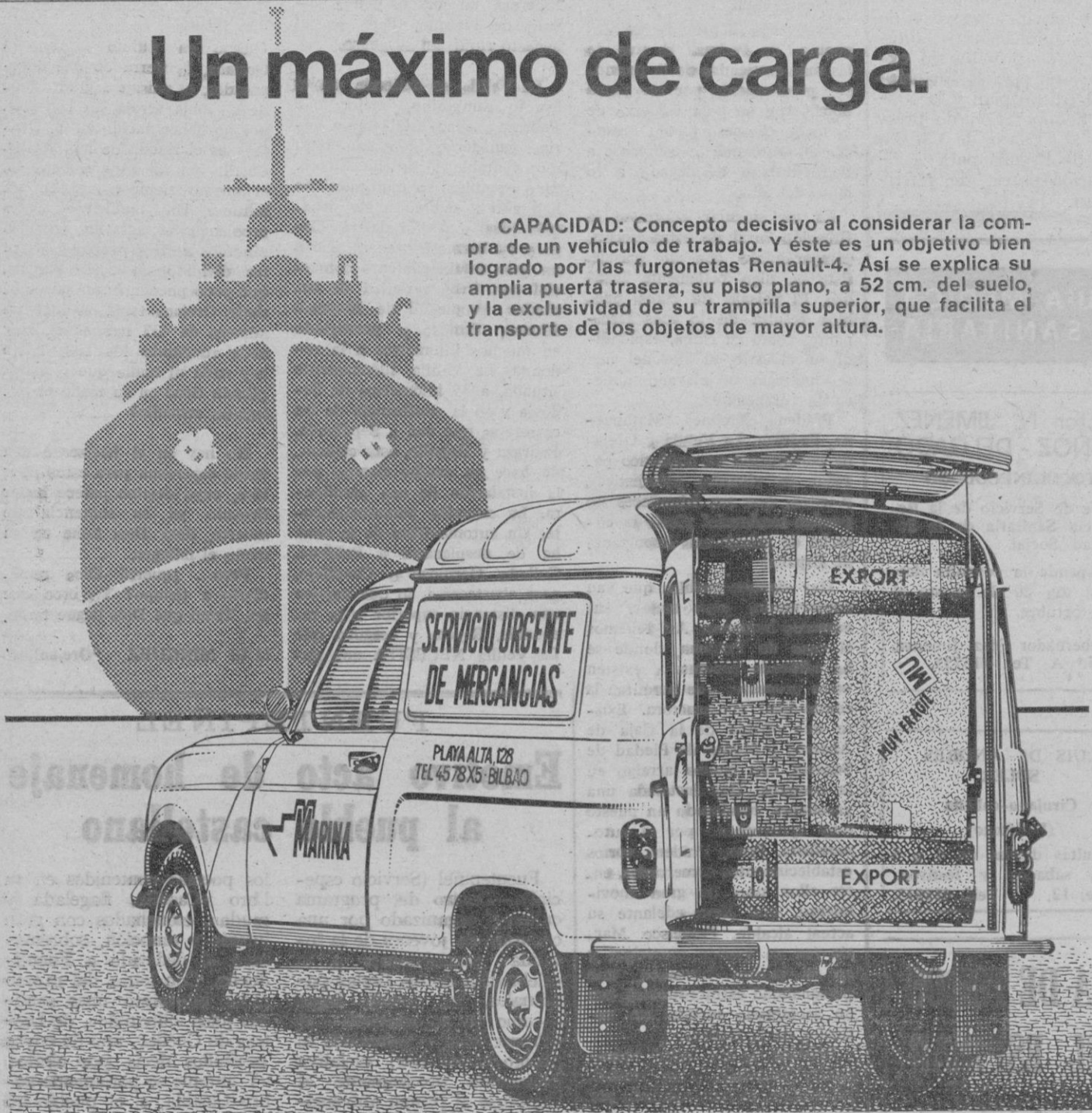
Renault 4 furgoneta. Consumo 6 litros a los 100 Km.

CAPACIDAD: Concepto decisivo al considerar la compra de un vehículo de trabajo. Y éste es un objetivo bien logrado por las furgonetas Renault-4. Así se explica su amplia puerta trasera, su piso plano, a 52 cm. del suelo, y la exclusividad de su trampilla superior, que facilita el transporte de los objetos de mayor altura.