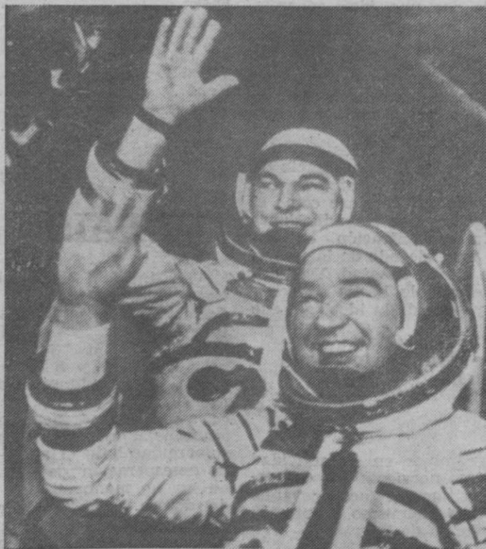
Los cosmonautas soviéticos Yuri Romanenko y Georgie Grecko dicen adiós poco antes de ser lanzados al espacio en la nave espacial "Soyuz 26", que fue puesta en órbita desde Baikonur (URSS) para experimentar con la estación "Salyut 6".