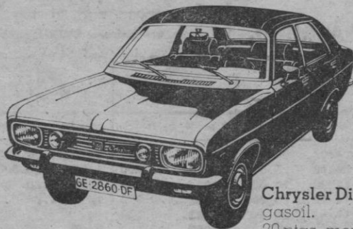
Chrysler Diesel. gasoil. 20 ptas. menos por litro.

Por cara que se ponga la gasolina, Chrysler España siempre tiene previsto el ahorro. Por eso siempre dispone de coches que no gastan gasolina, o que la gastan barata.