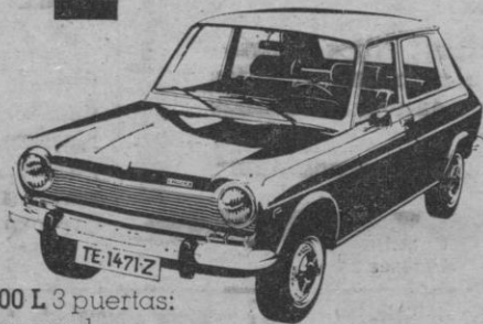
Simca 1200 L 3 puertas: gasolina normal. 6 ptas. menos por litro.