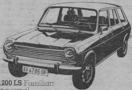
Simca 1200 LS Familiar: gasolina normal. 6 ptas. menos por litro.