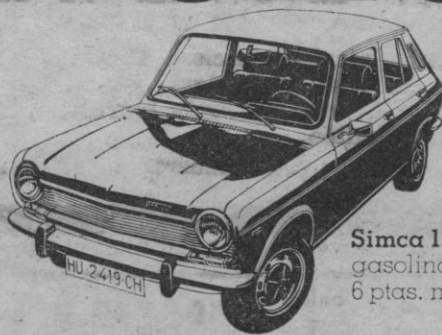
Simca 1200 LS 5 puertas: gasolina normal. 6 ptas. menos por litro.