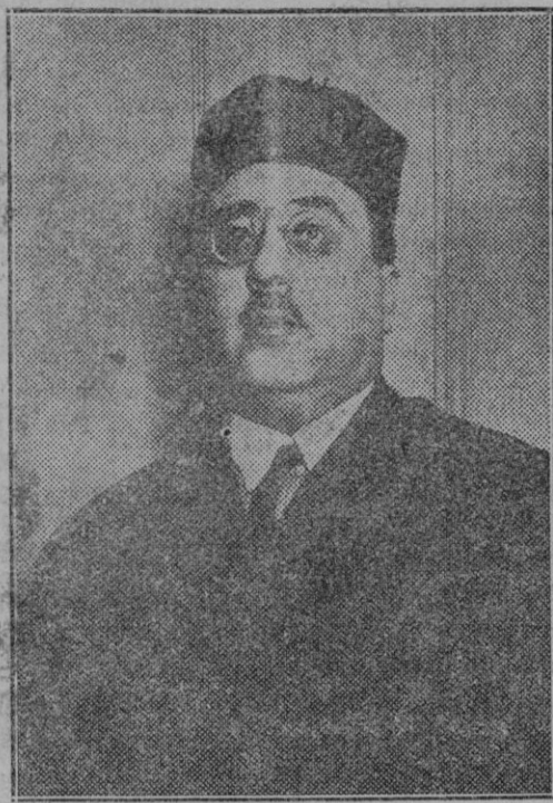
Don Luis Rodríguez de Vigari, nuevo ministro de Economía Nacional

Se pasó el dictamen a votación, aprobándose por el voto a favor de todos los presentes, con la sola ex-