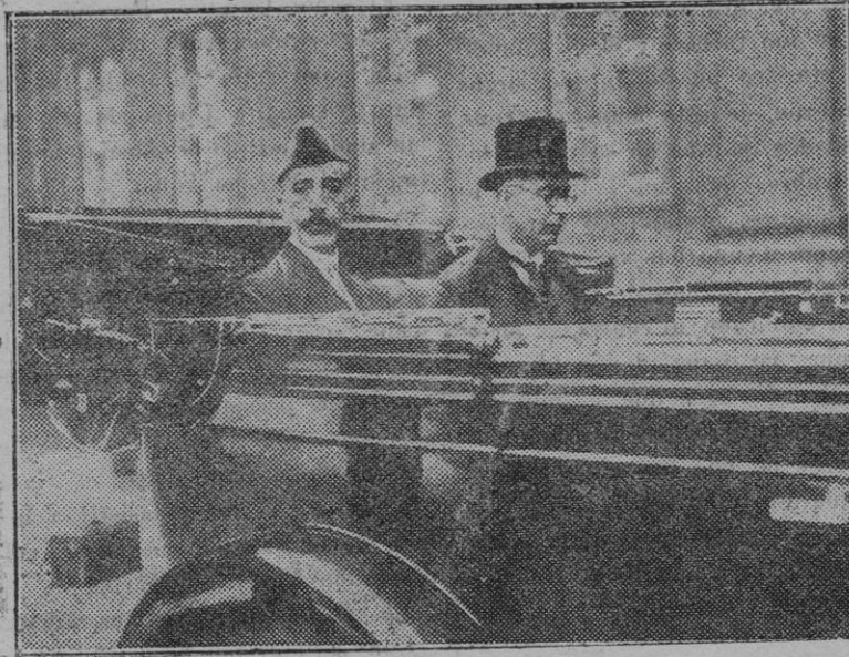
Berlín. — El rey Feisal, del Irak, dirigiéndose al palacio presidencial para visitar al mariscal Hindenburg.

Finalizados los divinos oficios, las autoridades, comisión de festejos y distinguidas personalidades asistentes, se trasladaron a la Casa Rectoral, donde tuvo lugar una recepción y "lunch".