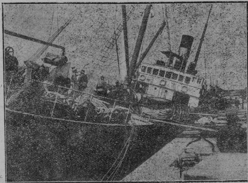
Barcelona. — Aspecto que ofrecía la cubierta del buque de carga y pasaje "Roberto R", durante los trabajos realizados por los bomberos para sofocar el incendio.

En la mencionada Junta se dió cuenta de los ingresos del presente año. Procede de los trabajos hechos por la Comisión de Investigaciones en el poblado romano de Son Sard, en la cueva de enterramientos cinerados del "Morro", donde se han recogido datos interesantes, que vienen en apoyo de la hipótesis sostenida anteriormente en trabajos publicados por dicha Comisión sobre el origen prerománico de las mencionadas cuevas, y algunos otros objetos extraídos del "talaiot" del "Rafal Calloges", de Son Burguet, Son Bou y de otros "talaiots", o donados por particulares.