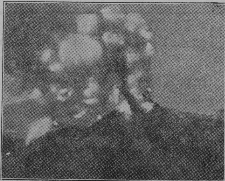
Nápoles. — Una curiosa fotografía del cráter del Vesuvio actualmente en erupción.

Reciba el Prelado vicense nuestra efusiva y cordial bienvenida.