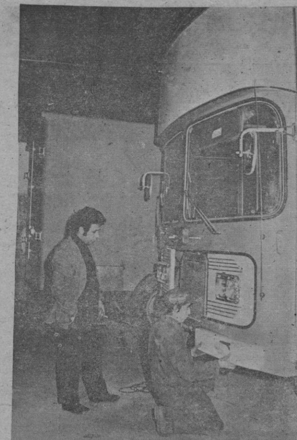
Existen en Segovia empresas con proyección nacional a las que habrá que cuidar

7. Interesa la creación de escuelas de formación ganadera, a establecer en la sierra segoviana, desde El Espinar hasta Riaza. Aprovechando la próxima inauguración de la Residencia Sanitaria de la Seguridad Social.