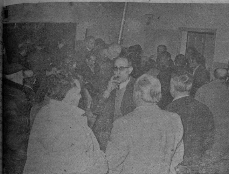
Este foto recoge un paso importante: la firma de escrituras por FEMSA

Las soluciones que proponemos para salir de esta situación, se concretan en los cinco puntos siguientes: Vías de comunicación, Suelo industrial, Vivienda y