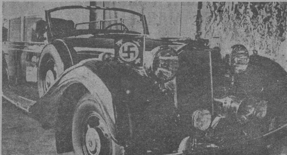
Un coleccionista ha comprado por 176.000 dólares (unos 10 millones y medio de pesetas) el coche de Adolfo Hitler, un Mercedes blindado, de 1940. El automóvil está expuesto en Chicago, en el Museo de Coches Antiguos.