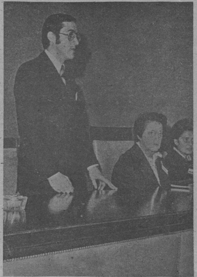
El delegado nacional de la Juventud, Manuel Valentín-Gamazo presidió, acompañado de Pilar Primo de Rivera y otras personalidades, el I Pleno de la Asamblea Nacional de Jóvenes, en Madrid, al que asisten representantes de toda España.