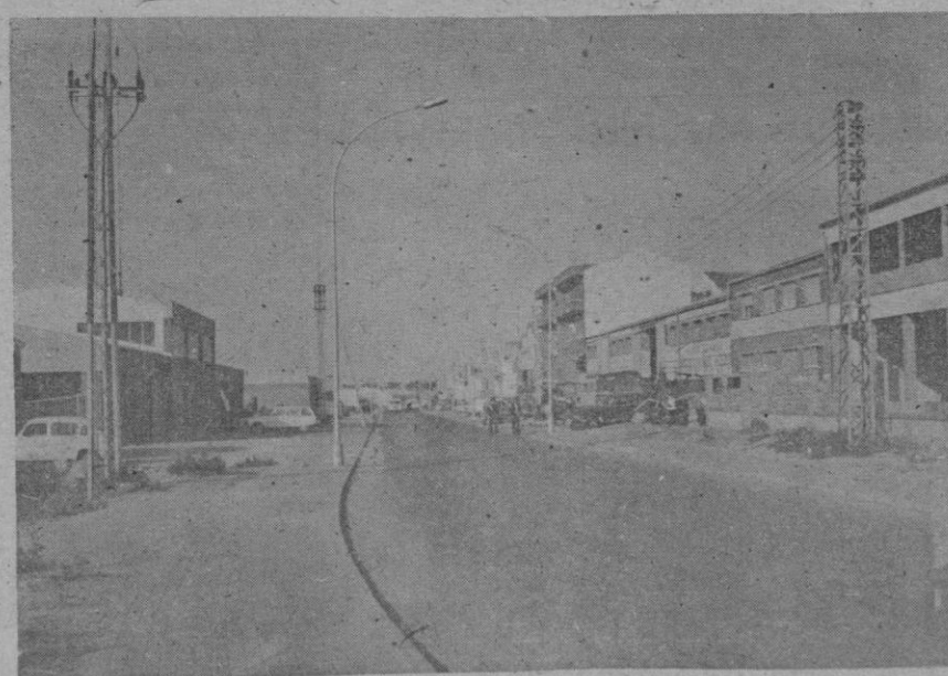
En el Polígono Industrial «El Cerro» se tienen muchas esperanzas puestas para la industrialización de Segovia. Los industriales segovianos respondieron al llamamiento hecho, trasladándose a aquel Polígono pese a los imponderables que sabían adolecer aquella zona. No se les puede dejar ahora allí sin ayuda

Dadas las malas condiciones higiénicas de Nápoles, el profesor Lorenzutti declaró que es necesario adoptar toda clase de precauciones, y no descartó que pudiera declararse una epidemia, aunque este género de paratíficas sería benigno.—Efe.