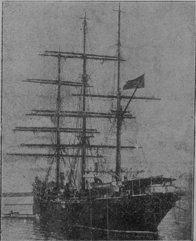
El Buque escuela "Galatea" que actualmente visita el puerto de Barcelona, en viaje de prácticas, llevando a bordo 300 aprendices marinos.

—Ojalá, señor mío, ojalá. Mas no exagero un punto... ¡Claro! Ustedes "desde las alturas..."