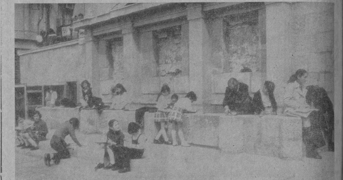
Desde la terraza de Santa Columba, un grupo de artistas juveniles van trazando la silueta del Acueducto

Se celebró ayer por la mañana la primera sesión del certamen juvenil de arte, convocado por las delegaciones provinciales de la Juventud y Sección Femenina, coordinado por la de Cultura del Movimiento. Más de un centenar de futuros artistas, comprendidos entre las edades de diez a doce años, se dieron cita al pie mismo del Acueducto para intentar reflejar en dibujos originales las distintas perspectivas del monumento. En líneas generales la calidad de los trabajos fue muy meritoria y se puso en evidencia, una vez más, la oportunidad de esta convocatoria, que contribuye a despertar la vocación artística entre los niños segovianos.