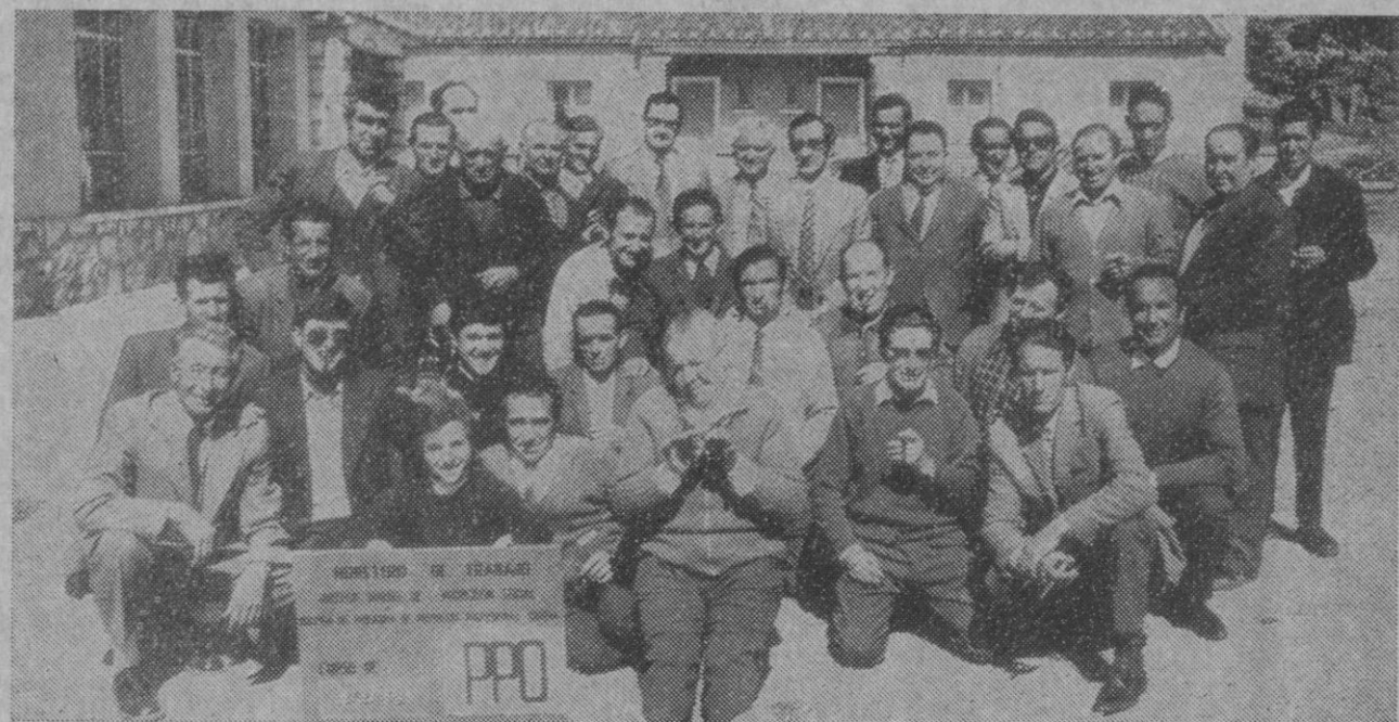
Gallegos.—Se ha celebrado en esta localidad la clausura de un curso que, sobre ganadería, ha venido desarrollando personal técnico de la Gerencia Provincial de P. P. O. A dicho acto de clausura asistieron el delegado provincial de Trabajo, gerente de P. P. O. y monitores del curso, así como las autoridades de la localidad