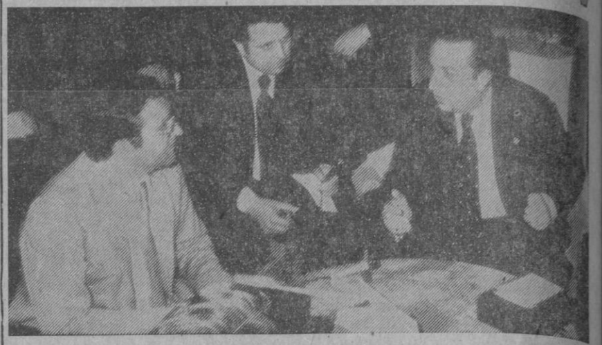
El director general contesta a una de las preguntas de nuestro redactor

francamente, que se entienda la palabra apertura por "destape" o erotismo... No se trata de nada de eso... Miren ustedes, se trata sencillamente de que los españoles vean el cine que debe verse, el cine que tenga un interés, el cine que tenga un mensaje, que sirva para formar e informar... Aquello que no tenga más que un puro valor innoble, no debe verse, ni se verá... Insistiré en un