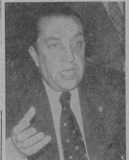
«Apertura, sí, pero sin caer en lo chabacano»

Por otra parte se han abierto los cauces de un nuevo crédito cinematográfico, cuyos detalles estamos concluyendo, contemplando la realidad del fenómeno del cine. Con ello se va a crear, o recrear, como ustedes prefieran, la industria. Y ya tienen ustedes ahí uno de los "hermosos" problemas del cine, que si lo resolviéramos bien, habríamos puesto los pilares de un futuro esperanzador.