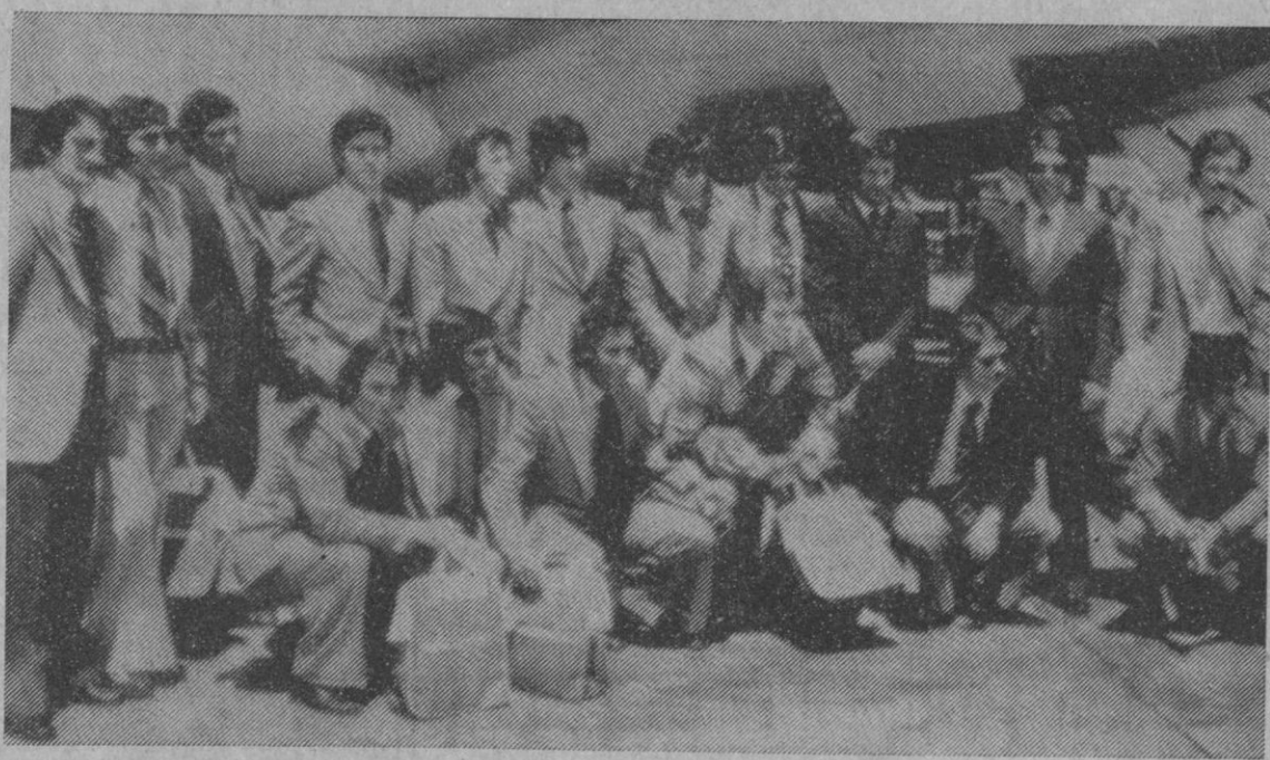
Este es el equipo del Atlético de Madrid que el miércoles se enfrentará al Bayern de Munich, en Bruselas, en la final de la Copa de Europa. En la fotografía, momentos antes de iniciar el vuelo en Barajas hacia la capital belga