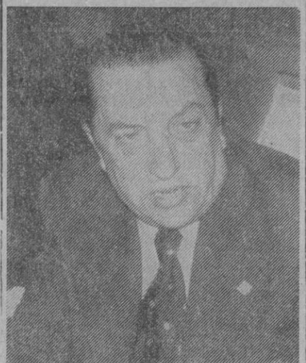
«La próxima Ley de Cine clarificará por completo esta actividad»

—Agradezco esas frases de elogio y si puedo decir que he tenido un gran interés por todo lo segoviano, entre otras—todo hay que decirlo