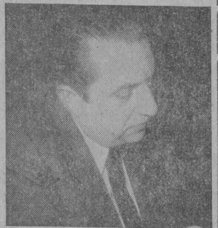
«Segovia debe pensar en la institucionalización de un Festival monográfico»

govia para clausurar la Semana Especial de Cine y, según se nos convocó, para dialogar largo y tendido sobre este caso concreto—la Semana—y otros aspectos generales del cine. Sin embargo, todo el propósito estuvo a punto de irse al traste precisamente por parte de algunos de los organizadores de la reunión, con una desconsideración ostensible para los hombres que estábamos cumpliendo nuestra labor. Afortunadamente el tratamiento que nos dio el señor Díez Alonso fue bien distinto y si no totalmente sí en una parte sustancial pudimos hilvanar con el parte del diálogo que se había previsto. Pero, vayamos con lo que realmente interesa, al margen de las acetonas y el güisqui.