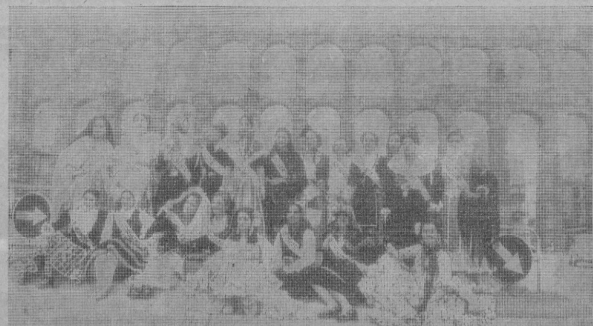
Como magnífico telón de fondo, el Acueducto, que seguramente se conmovió un poco en sus dos mil años ante la embajada juvenil