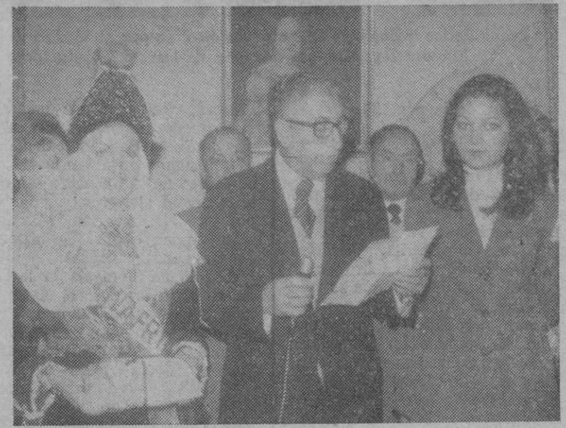
El alcalde de Segovia—acompañado por la «Maja de España 1973» y la «Maja de la Provincia»—lee unas hermosas palabras de bienvenida