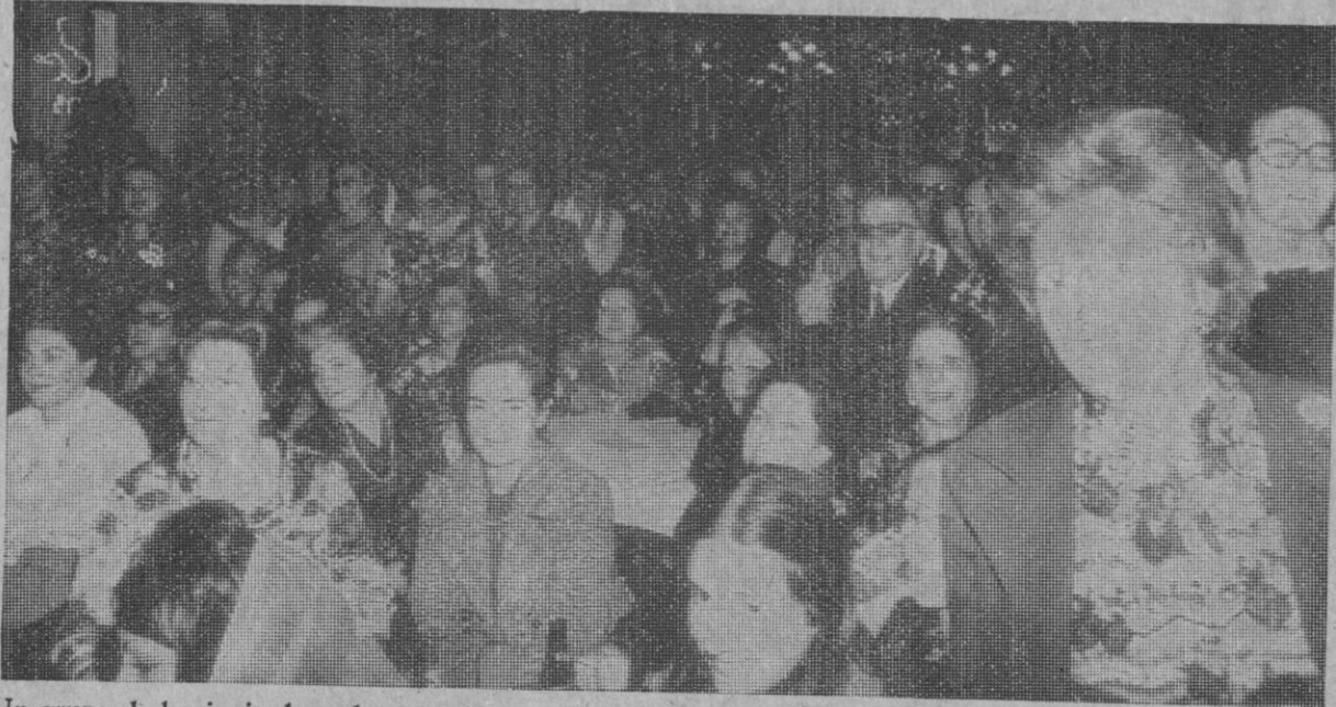
Un grupo de los invitados a la recepción ofrecida por el Casino de la Unión sonríe abiertamente ante la humorística respuesta que una de las «Majas» ha dado a la pregunta del locutor