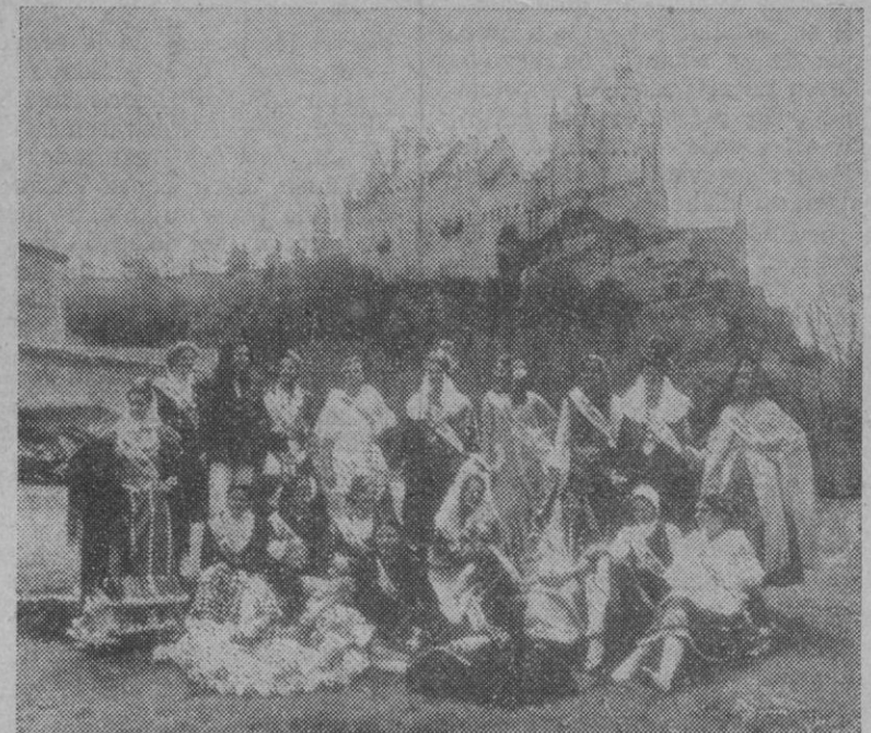
«Majo» es el fondo, ciertamente, ¿pero quién va a dudar de la prestancia de un ramillete de muchachas como éste?