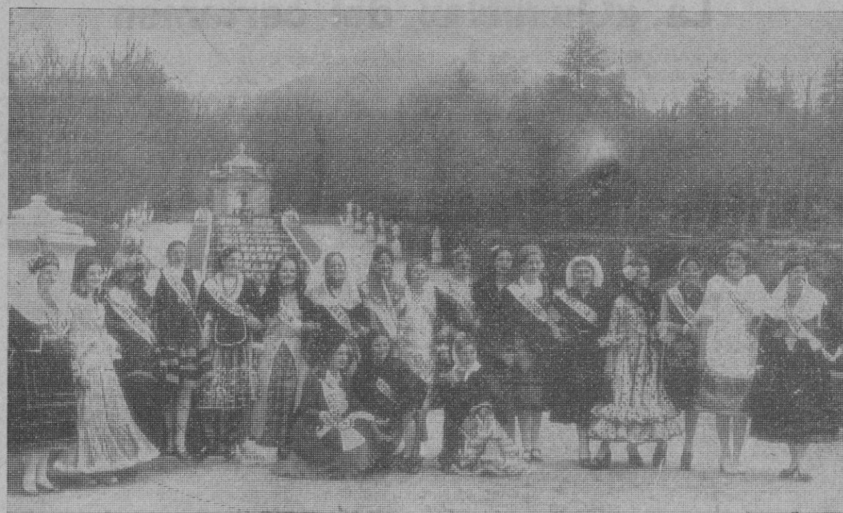
Fotografía para el recuerdo en los jardines de La Granja