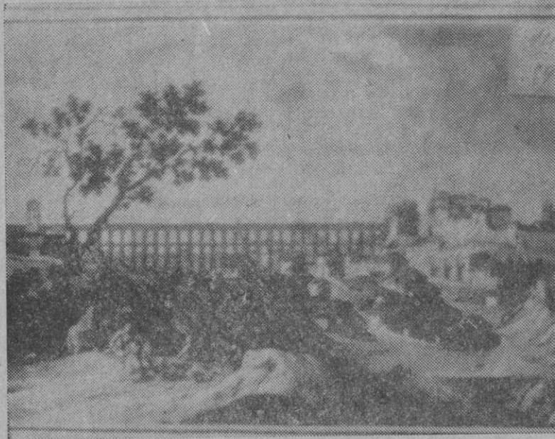
Estampa de una Segovia ya ida. El acueducto visto por un artista italiano de otra época

Así y todo, en un determinado momento que la tradición sitúa en el 616 a. de J. C., el elemento etrusco pudo hacerse con el po-