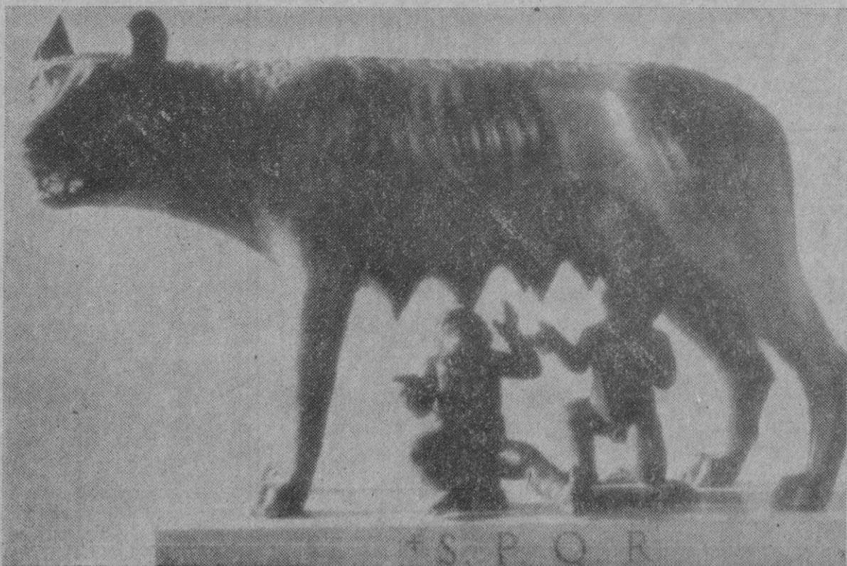
La Loba del Capitolio es una escultura etrusca a la que en el s.º XVI se añadió el grupo de los pequeños lactantes. La copia, aquí reproducida, se va a situar en una de las zonas verdes de la Plaza Oriental.

El pueblo romano había logrado su unidad. Era el primer gran paso.