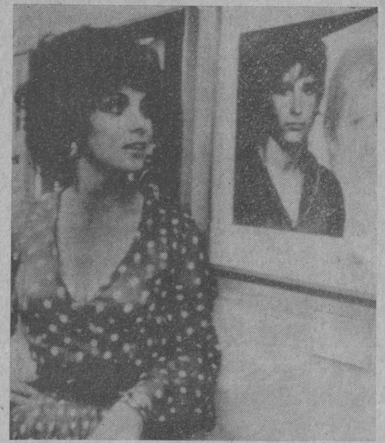
Por lo visto Gina Lollobrigida vale para todo. Excelente actriz; excelente fotógrafa, como demostró con su obra «Italia mía», y ahora pintora, que expone en Tokio. Y, por encima de todo, bella como siempre