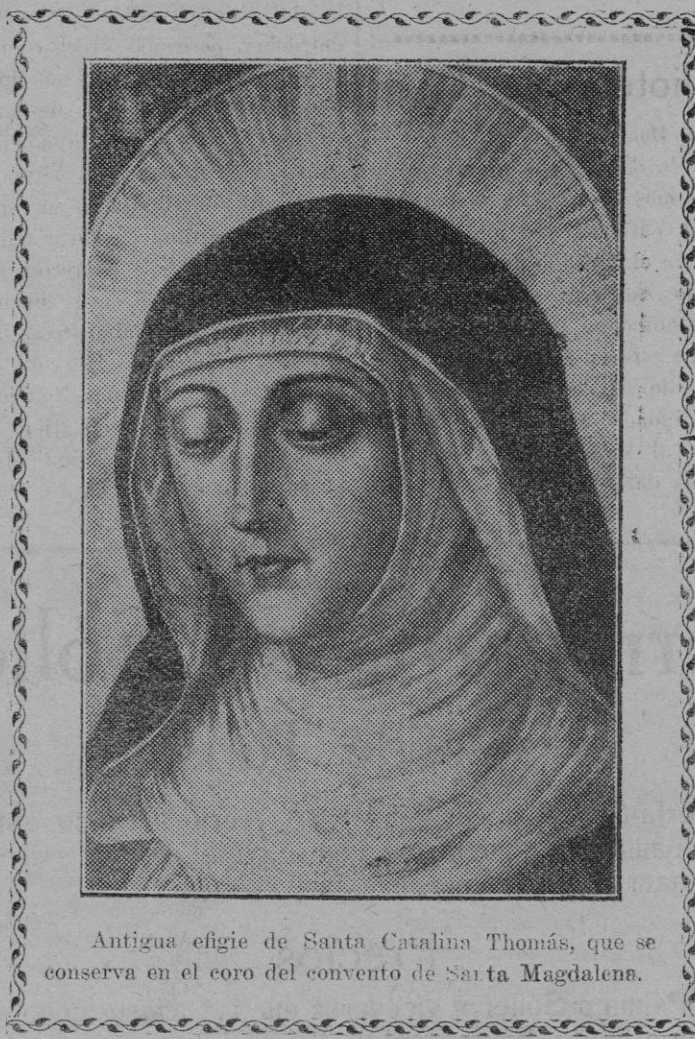
Antigua efigie de Santa Catalina Thomás, que se conserva en el coro del convento de Santa Magdalena.