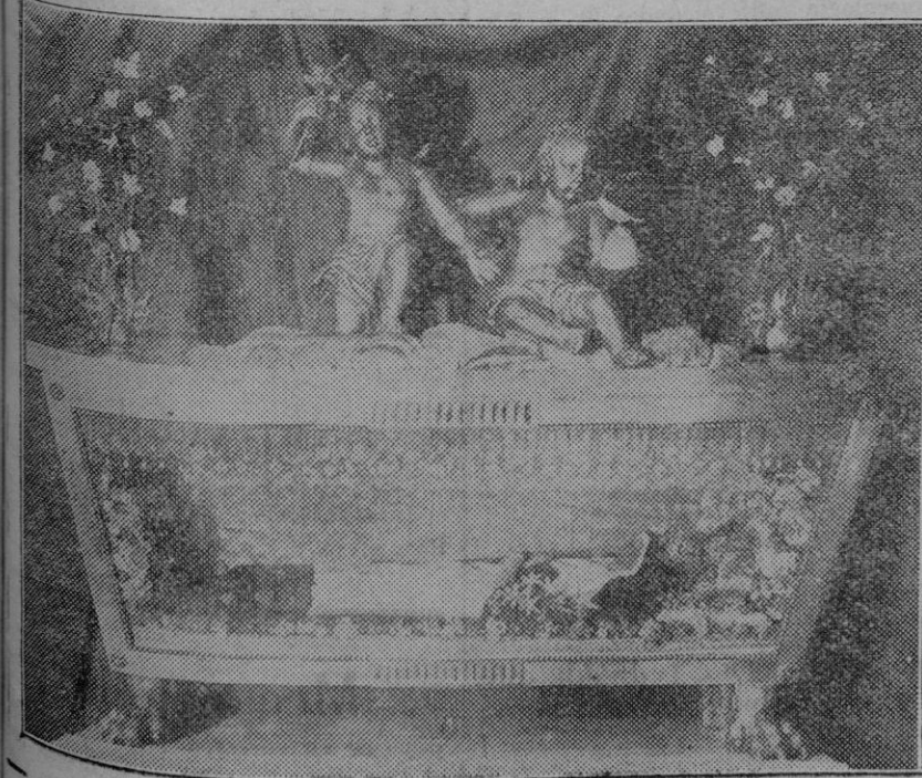
Sepulcro de Santa Catalina Thomás en la iglesia del convento de Santa Magdalena.