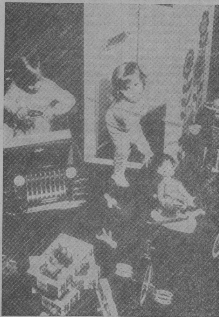
Los psicopedagogos han podido probar que los niños educados en habitaciones en las que dominan los tonos oscuros, progresan menos rápidamente que otros que viven en habitaciones de colores alegres

Y aun para nosotros mismos. El color rojo favorece el trabajo intenso y controlado, el gris en cambio le enfría. Pues bien pintemos nuestros cuartos de estar con intensos tonos alegres, nuestros dormitorios con verdes sedantes, y el derroche de la fantasía en el dormitorio de los pequeños. Flores, pájaros, animales... y en sitio preferente la imagen de la Virgen de azul intenso. Los niños entenderán, crecerán sanos y alegres.