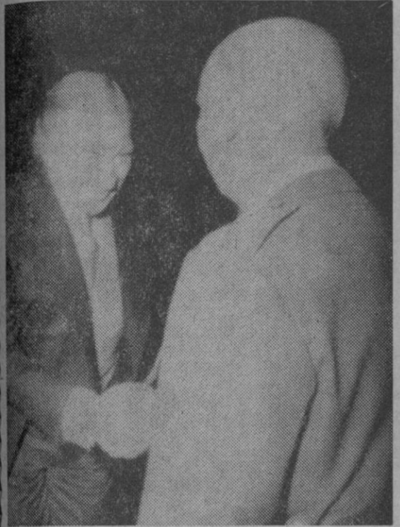
Su Excelencia el Jefe del Estado saluda a Henry Ford II, presidente de la Ford Motor Corporation, a quien recibió en audiencia en el palacio de El Pardo

En el Ministerio de Trabajo firmó luego el convenio para la formación profesional del personal de Almusafes