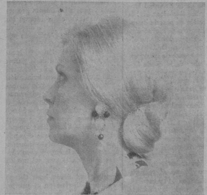
En las fotografías, arriba, elegantes vestidos de noche y de calle; abajo, desfile de modelos infantiles y elegante peinado