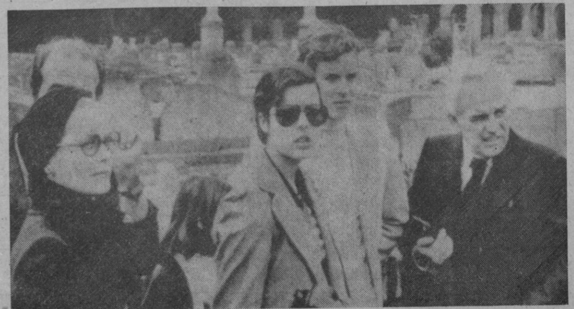
Los Príncipes de Mónaco, acompañados de sus hijos, en un momento de su estancia en Roma, durante la visita que con carácter privado realizan estos días a Italia