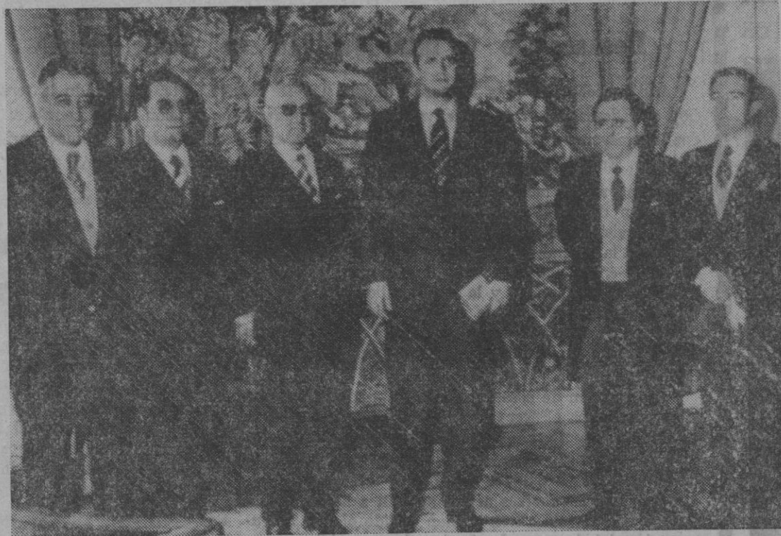
El Príncipe de España aparece junto al ministro de Información y Turismo, subsecretario de este Departamento y el gobernador civil, presidente de la Diputación y alcalde de Segovia

En la entrevista estuvo presente el ministro de Información y Turismo