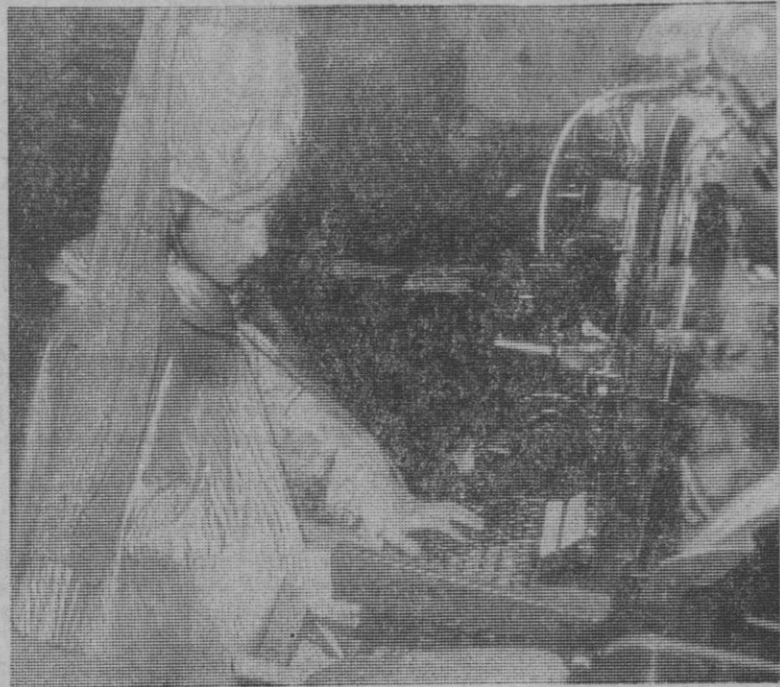
Las linotipias llamaron particularmente la atención del Príncipe Aliatar. Quiso componer en una de ellas una nota de saludo para Sus Majestades de Oriente

dida en una amplia y cordial sonrisa y ofreciéndonos su mano para estrechársela.