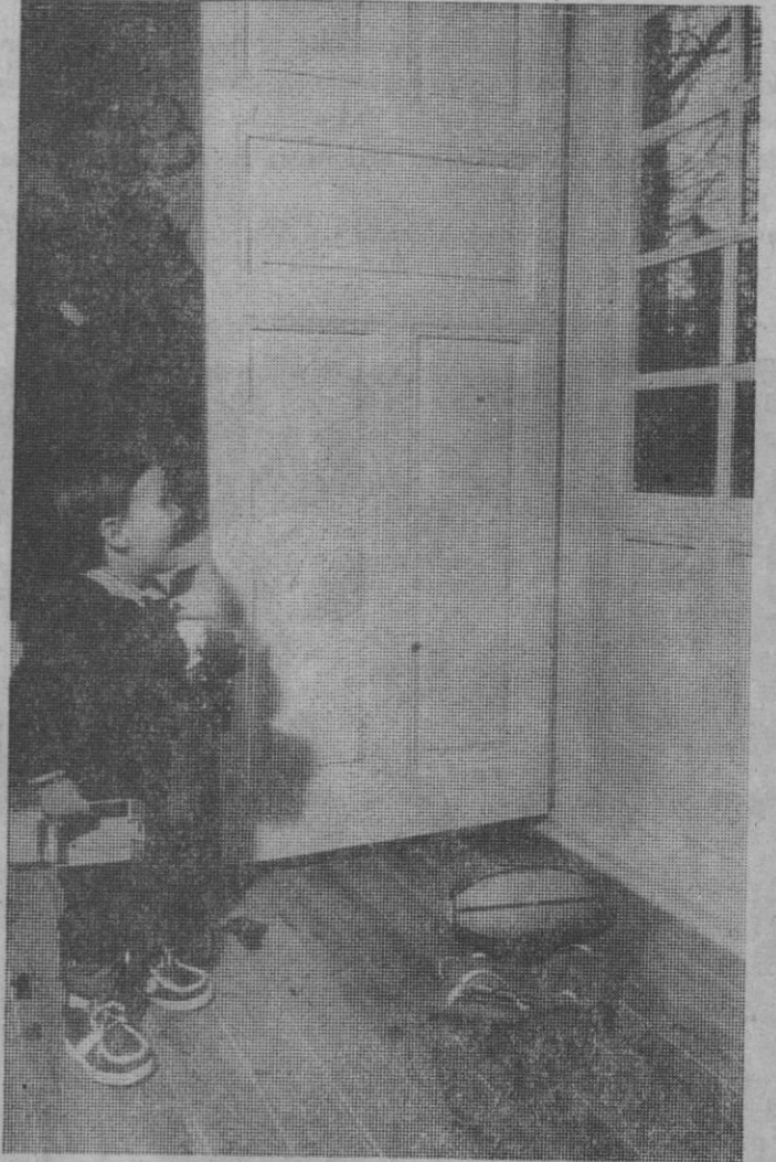
Alegria incontentada. El pequeñín acaba de descubrir los regalos que han dejado en su balcón los Magos de Oriente