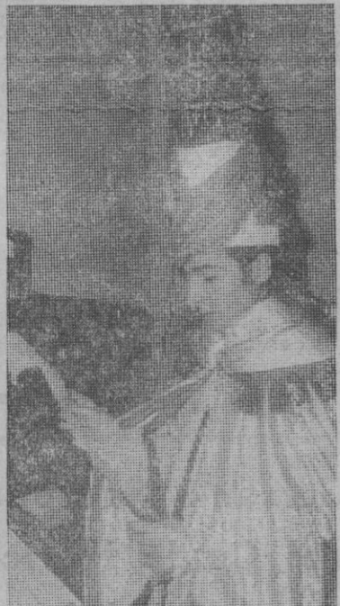
El Príncipe Aliatar mira atentamente las noticias que van saliendo del teletipo. Buscaba aquella que anunciara a todo el mundo la buena nueva de la paz lograda por los hombres.

Nos lo anunciaron hace algún tiempo sus «enviados especiales»: el día 4 de enero vendría a Segovia el Príncipe Aliatar, mensajero de los Reyes Magos. Se ha cumplido la promesa, pues esta mañana ha estado en nuestro periódico, rodeado de toda la pompa y boato que le acompaña por todo el mundo. Su nutrida escolta queda, discretamente, en un segundo plano. Como es fácil imaginar, su entrada en la Redacción ha sido deslumbrante. Hasta el monótono sonido de los teletipos —constantemente volcando noticias de todo el mundo— parece que se ha hecho más tenue. Hemos parado unos momentos en nuestro quehacer para salir a recibir a tan importante personaje. Uno a uno nos ha ido saludando a todos los que trabajamos en esta casa, la boca disten-