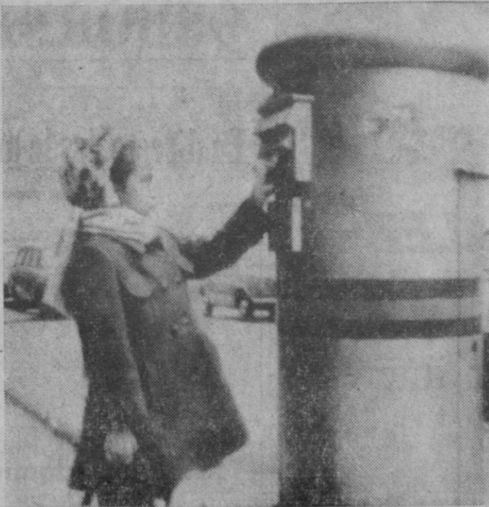
La niña acaba de depositar en el buzón su carta a los Reyes Magos. En unas cuantas líneas va prendida toda su ilusión