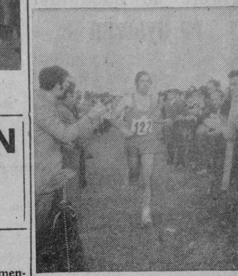
El vencedor en la categoría senior, entrando en la meta.