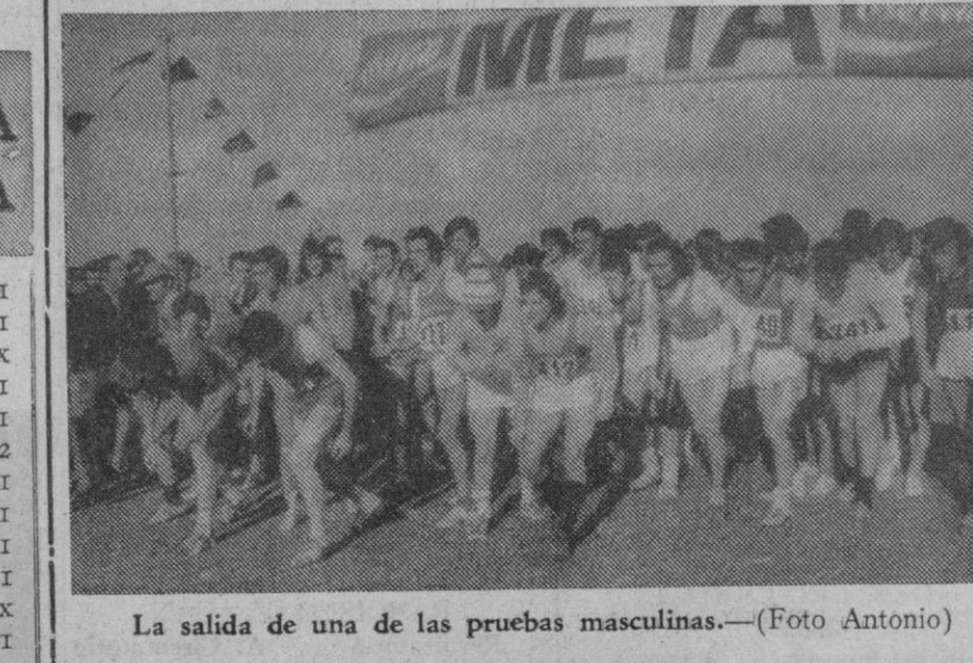
La salida de una de las pruebas masculinas.