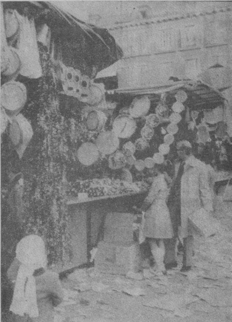
En Madrid, como aquí, como en todas partes, los puestos callejeros de venta de objetos ambientadores de la Navidad han hecho ya su aparición. Ahí tenemos un detalle de los instalados en la plaza Mayor madrileña. La Navidad que llega...