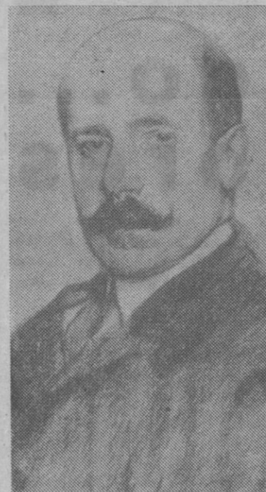
Retrato de Ignacio Zuloaga, por R. Casas

Interesado el Caudillo por conocer al autor de tan soberbia obra, Zuloaga reveló a Franco su identidad, y poco tiempo después de aquel señalado acontecimiento vivido por el pueblo de Zumaya, el escultor recibía de aquel el encargo de tallar otro Cristo en la cruz exactamente igual al que tanto le había impresionado con destino a la Abadía de la Santa Cruz del Valle de los Caídos. Cumplido fielmen-