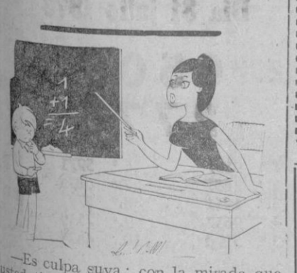
—Es culpa suya; con la mirada que usted tiene pierdo mi sangre fría.

Nuevos modelos «novias» y «Futuras mamás» Salón de Modas