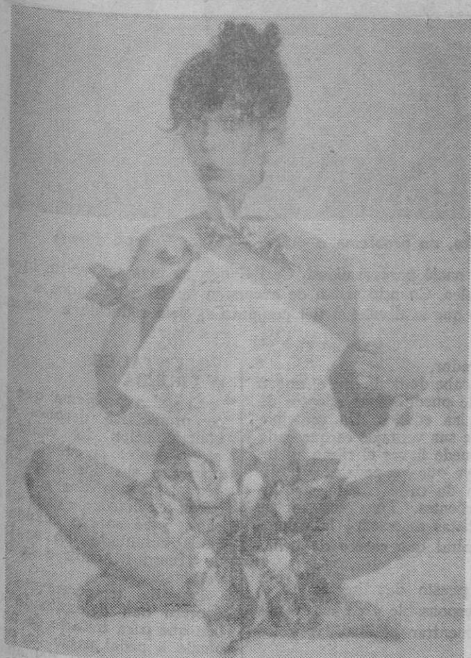
Los maravillosos estampados de los pañuelos de puro algodón han logrado, en esta ocasión, el marco adecuado para exhibirse con toda su fantasía.

Los príncipes de Moctezuma pasan el verano en una villa de Comarruga llamada «El Alero». Y en la actualidad están preparando una promoción turística para dar a conocer internacionalmente este bello rincón de España.