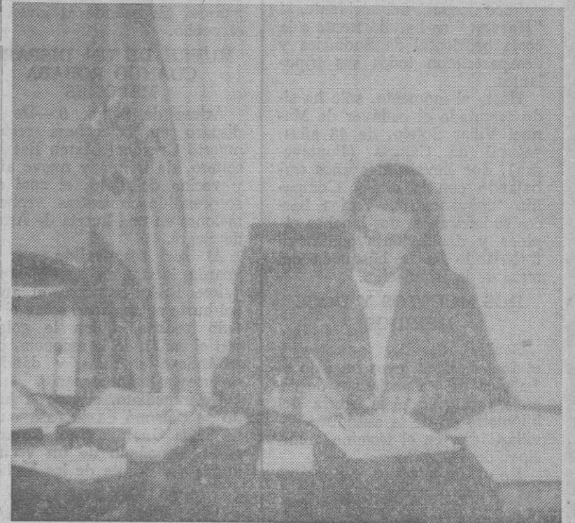
A todos un abrazo en nombre de Vendrell y en el mío propio.