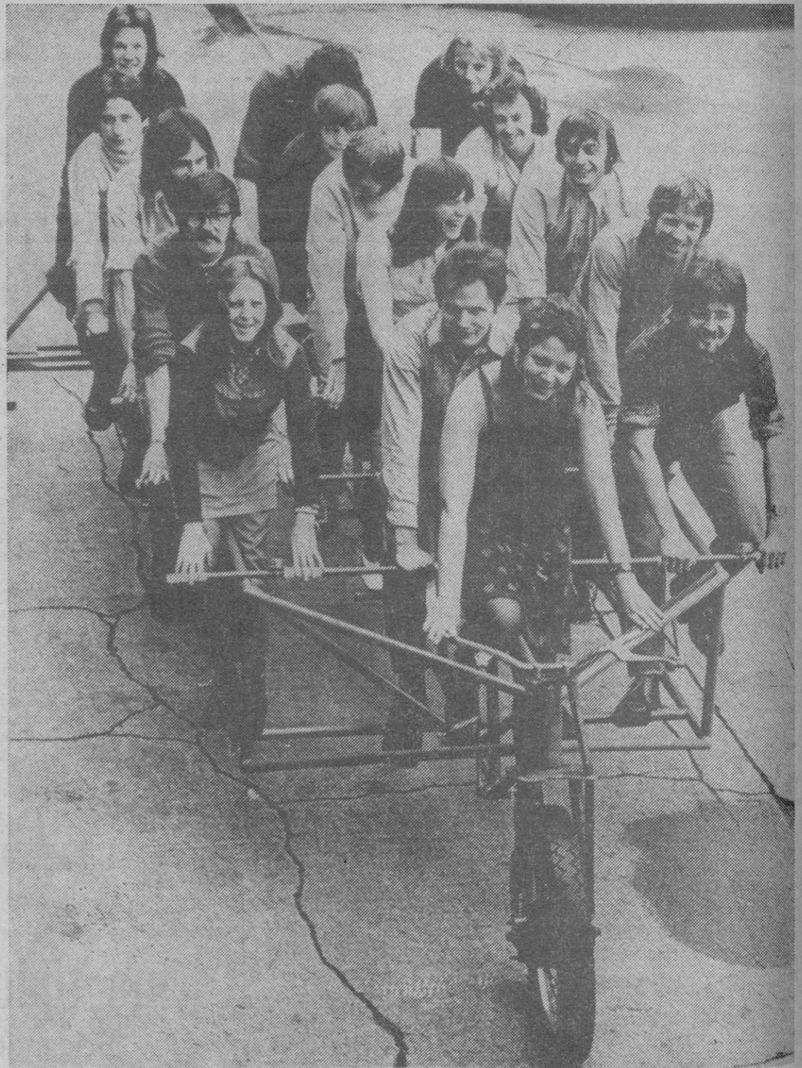
Conjugar dieciséis voluntades, un problema a prever.—(Foto Europa Press)

El «multiciclo» no fue un vehículo que nació por casualidad. Carl Canty, su inventor, es un ingeniero con un numeroso grupo de amigos del pedaleo. Cuando salían de excursión se veían obligados a circular por la carretera uno detrás de otro, con lo que la diversión del conjunto se veía reducida a contemplar la espalda del compañero de delante.