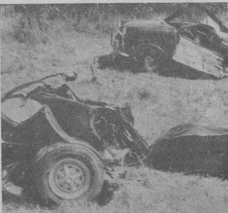
Un coche turismo con matrícula de Cádiz resultó partido en dos en el choque con un camión en la carretera de Medina a San Fernando de Cádiz. Los tres ocupantes del coche murieron.