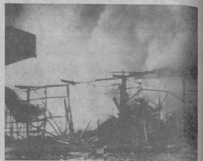
Colocado por un terrorista, al parecer, hizo explosión un artefacto en la consigna de la estación ferroviaria de Belgrado. Un empleado de la misma resultó muerto y otras siete personas heridas. El fuego ocasionado por la explosión destruyó el edificio.