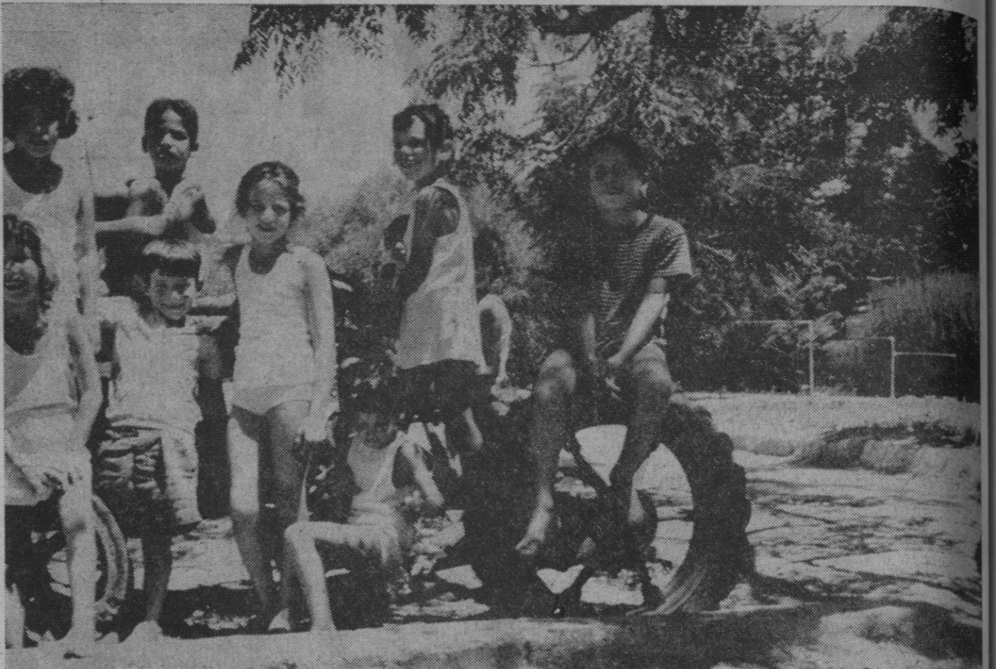
Niños judíos en el "kibutz"