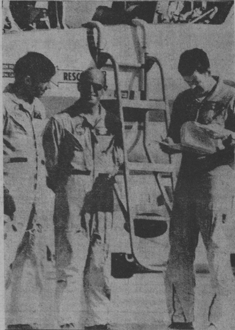
Paul Weitz, Charles Conrad y Joseph Kerwin, que serán los primeros tripulantes del «Skylab», han visto retrasada la fecha de su vuelo, camino de aquella nave, por la avería que sufrió poco después de su lanzamiento al espacio, ayer