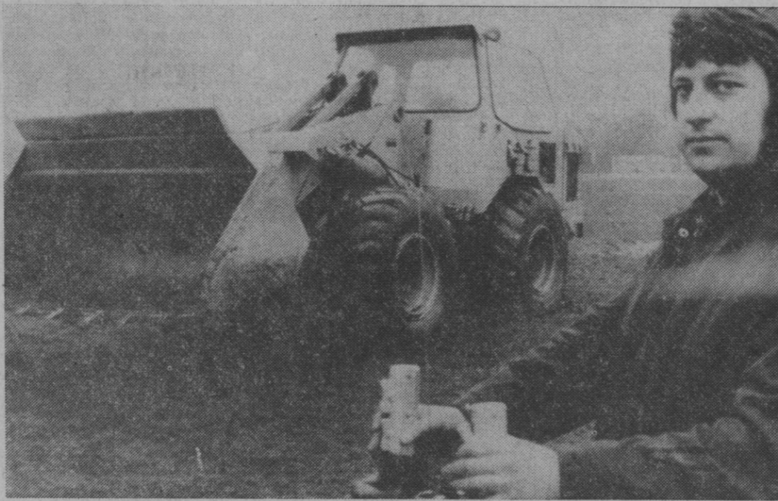
Esta cargadora con ruedas está destinada para ser empleada en el caso de eventuales accidentes durante el funcionamiento de reactores nucleares; igualmente para el transporte de material radiactivo. Es de fácil manejo, con mando a distancia