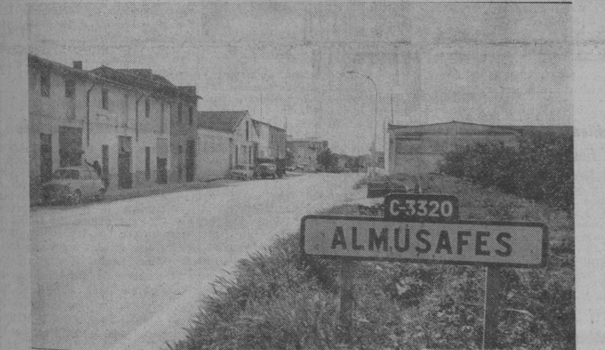
Almúsafer.—Este es el pueblo de la región valenciana que más probabilidades cuenta para la instalación de la factoría Ford, después de la noticia dada por el ministro de Industria en su reciente rueda de prensa. Hay otros dos lugares de los que se habla para concretar la instalación de la Ford, dentro de la misma provincia de Valencia.