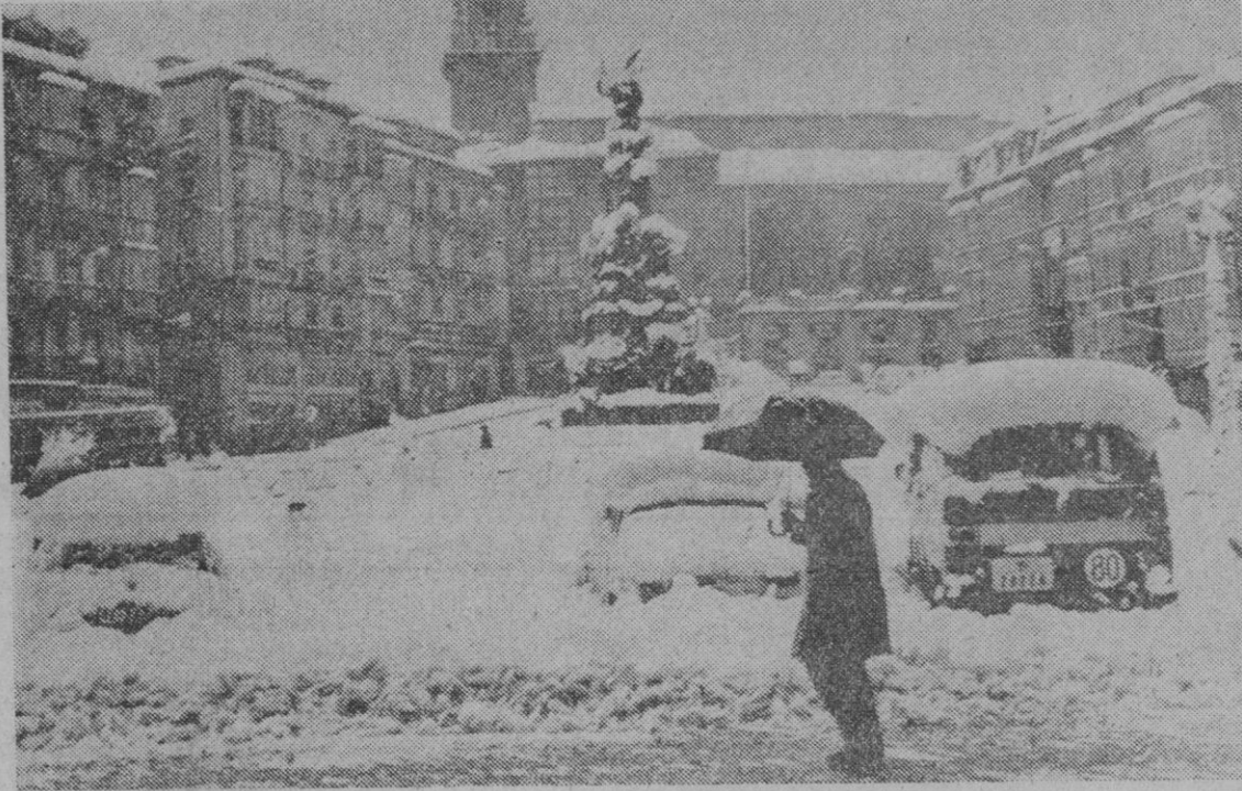
Una buena muestra del fuerte temporal de nieve que se está registrando en algunas zonas del país, la tenemos en esta estampa de la plaza de la Virgen Blanca, en Vitoria. No es frecuente esta imagen en el mes de abril

Sobre todo camiones, y el atasco es enorme