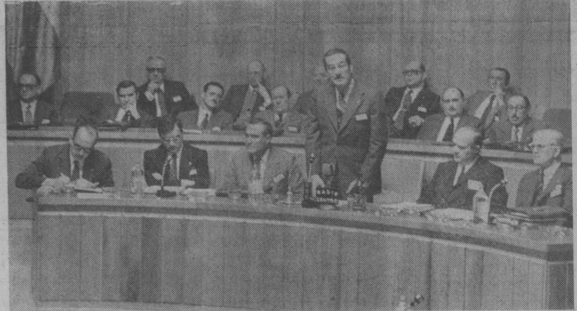
Madrid.—El ministro de Relaciones Sindicales, don Enrique García Ramal, durante la inauguración del V Congreso Sindical, que tendrá tres días de duración y en el que se discutirán las soluciones a diferentes problemas de orden laboral y económico.—(Telefoto AP-Europa Press)

Aprobado el proyecto de resolución sobre "Mercado Común" y "Comercio exterior"