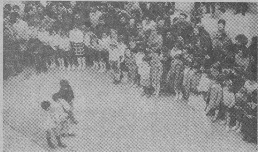
Escenificación de un cuento infantil