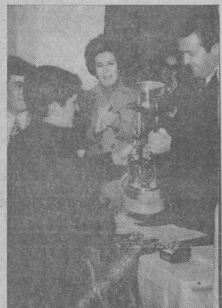
El subjefe provincial del Movimiento entregando uno de los premios

ble, con su esfuerzo y sacrificio, el éxito que estas demostraciones han puesto en evidencia.