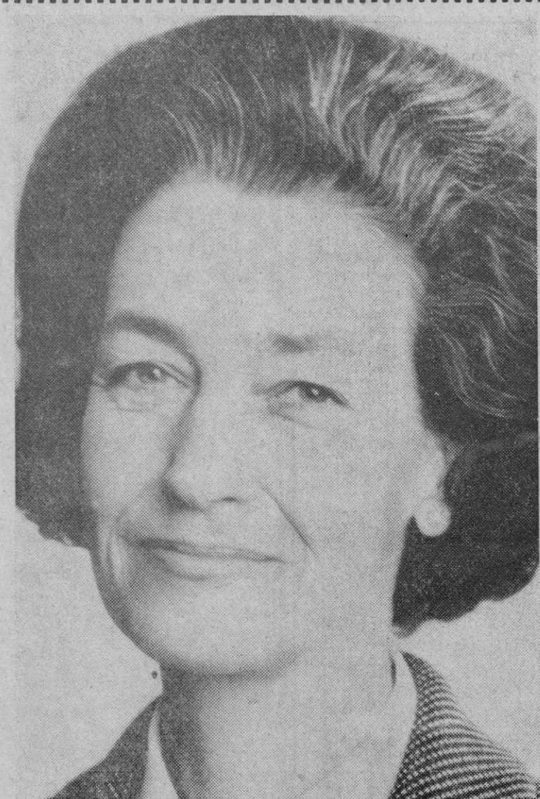
Bonn.—Cuando Katharina Focke fue elegida, en 1969, por primera vez diputada del Bundestag (Parlamento Federal), el canciller Willy Brandt la nombró inmediatamente subsecretaria parlamentaria. Tres años más tarde le ofreció la cartera para la Juventud, la Familia y la Salud Pública. Su éxito fue el resultado de un estilo de lucha electoral no convencional: Katharina Focke pronunciaba no sólo discursos de propaganda de partido, sino se metía también en mercados semanales y en cervecerías para así conseguir votos de electores.—(IAD)