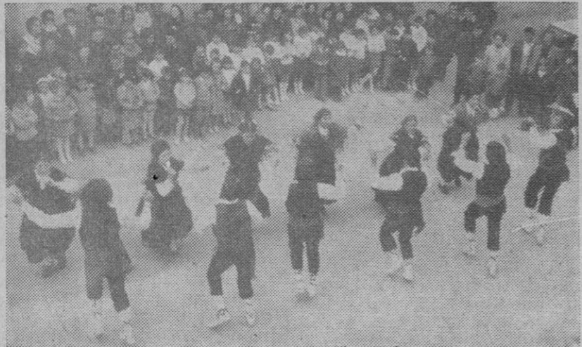
Exhibición de bailes típicos

Villaverde de Iscar. — El subjefe local para proceder a la clausura provincial del Movimiento, a quien de la cátedra ambulante de la Sección Femenina, que ha actuado durante dos meses, se desplazó a estas autoridades locales. Consejo Lo-