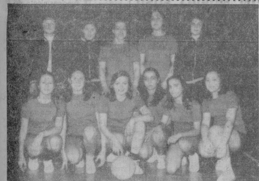
Equipo femenino de voleibol del Medina S. F.