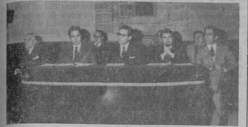
En una Universidad democrática la selección es necesaria para obtener un mayor rendimiento académico...