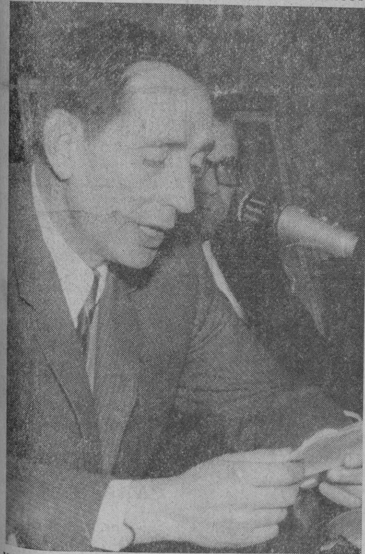
Madrid.—Foto de archivo de Miguel Delibes, que ha sido elegido académico de la Real Academia de la Lengua, para cubrir el sillón vacante por el fallecimiento del historiador don Julio Guillén.