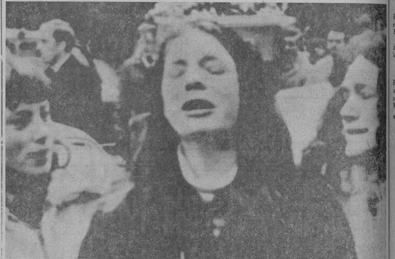
Los extremistas protestantes han incrementado su oleada de terror en Irlanda del Norte. Esta patética foto fue obtenida durante el entierro de cinco niños asesinados en Belfast. Ayer, un comando detuvo un autobús de trabajadores católicos y arrojó una bomba en el interior del vehículo: un hombre pereció y nueve resultaron heridos.—(Foto Europa)

Valencia, 1.—Altos ejecutivos de la Ford han visitado esta ciudad y han celebrado diversas reuniones de trabajo relacionadas con la instalación de su compañía en España. Han sostenido entrevistas asimismo con diversas autoridades locales. Los directivos de la empresa norteamericana recogieron numerosos datos para la elaboración del informe que han de presentar en su momento a la sociedad para su decisión. Los ejecutivos de la Ford salieron a última hora de la mañana con dirección a Madrid.—Logos.