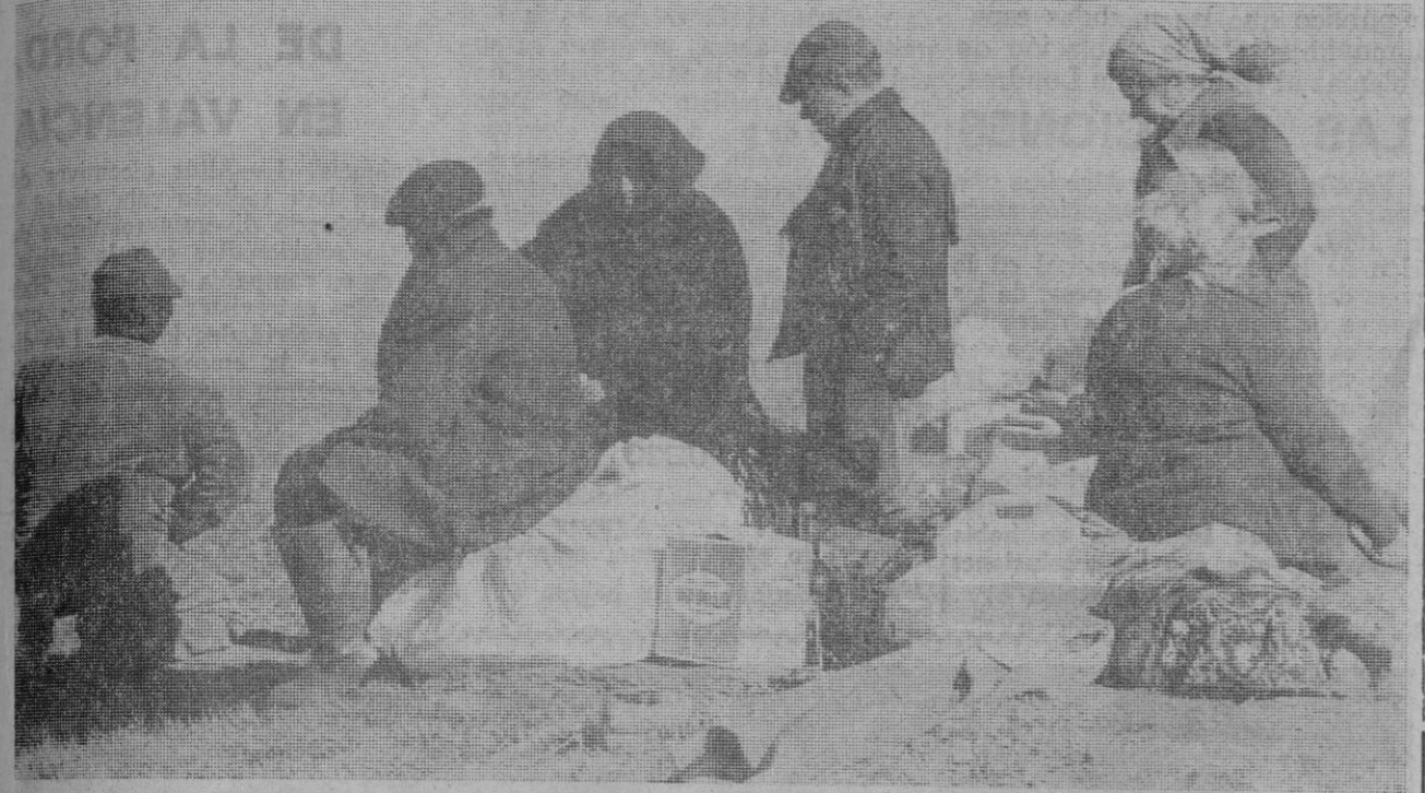
Hombres sin hogar, sin dinero, sin comida... pero con vida.

del terreno, ocasionada por fuerzas que actúan en el interior del globo, ya que, en ese caso, el reciente sísmico de Managua no se habría cobrado tantas vidas. Es más: no habría muerto nadie.