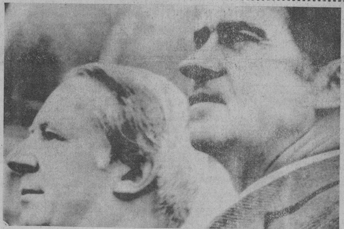
Washington.—El primer ministro británico, Mr. Edward Heath, y el Presidente Nixon, contemplan el principio de las ceremonias de recibimiento desde la Casa Blanca.

El cuadro de Joaquín Sorolla fue adjudicado en 2.760.000 pesetas, cantidad que significa una marca no alcanzada hasta ahora en las subastas de arte barcelonesas, según informa esta mañana «Diario de Barcelona».—Cifra.