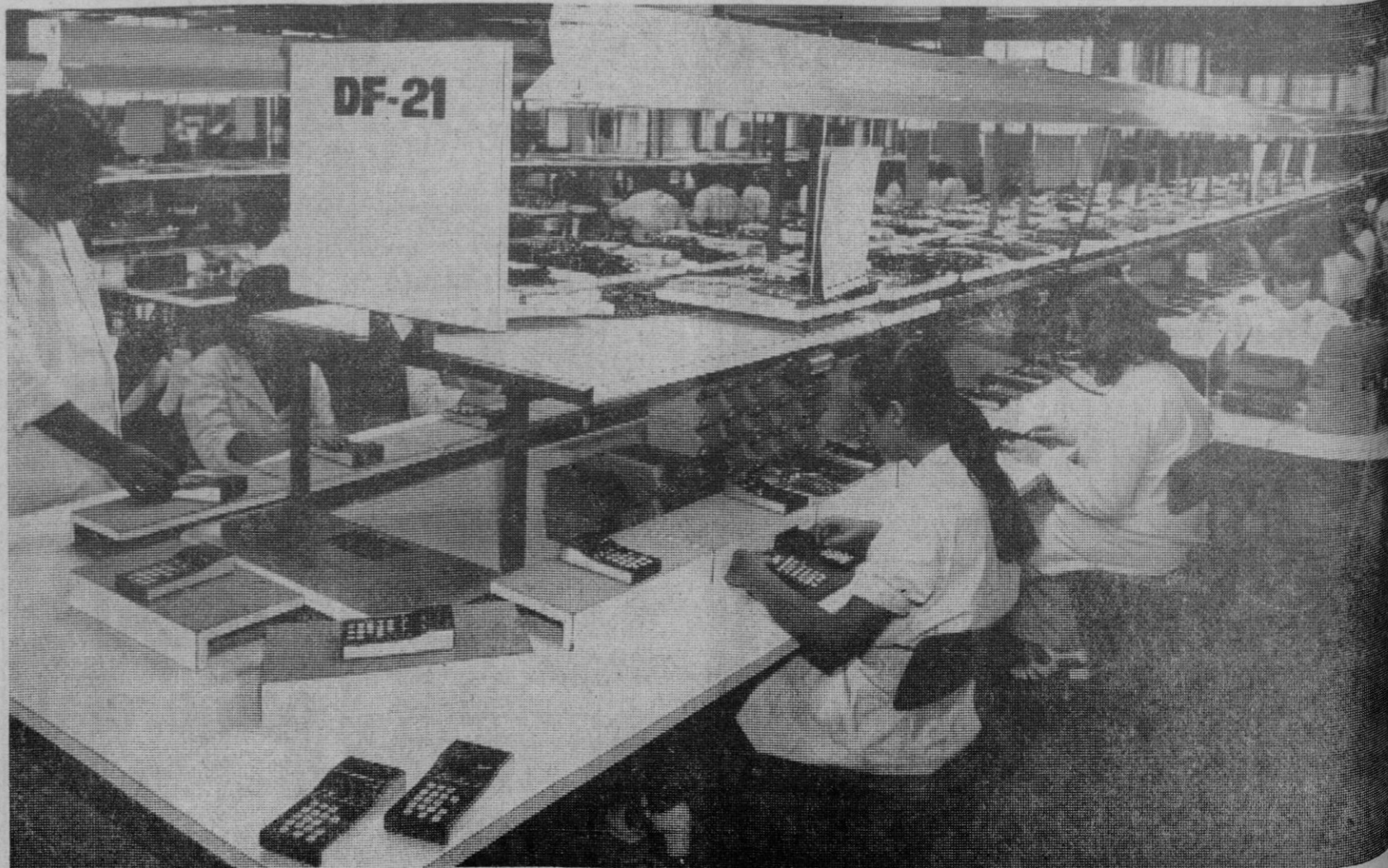
Perspectiva de una de las secciones de la fábrica en la que se trabaja en las calculadoras electrónicas

El interés que VANGUARD ha demostrado en la consecución de una industria a nivel mundial queda reflejado íntegramente con su actuación continuada, renovando métodos y programando nuevos sistemas, haciendo posible que una industria totalmente española haya logrado fabricaciones altamente competitivas en el ámbito internacional.