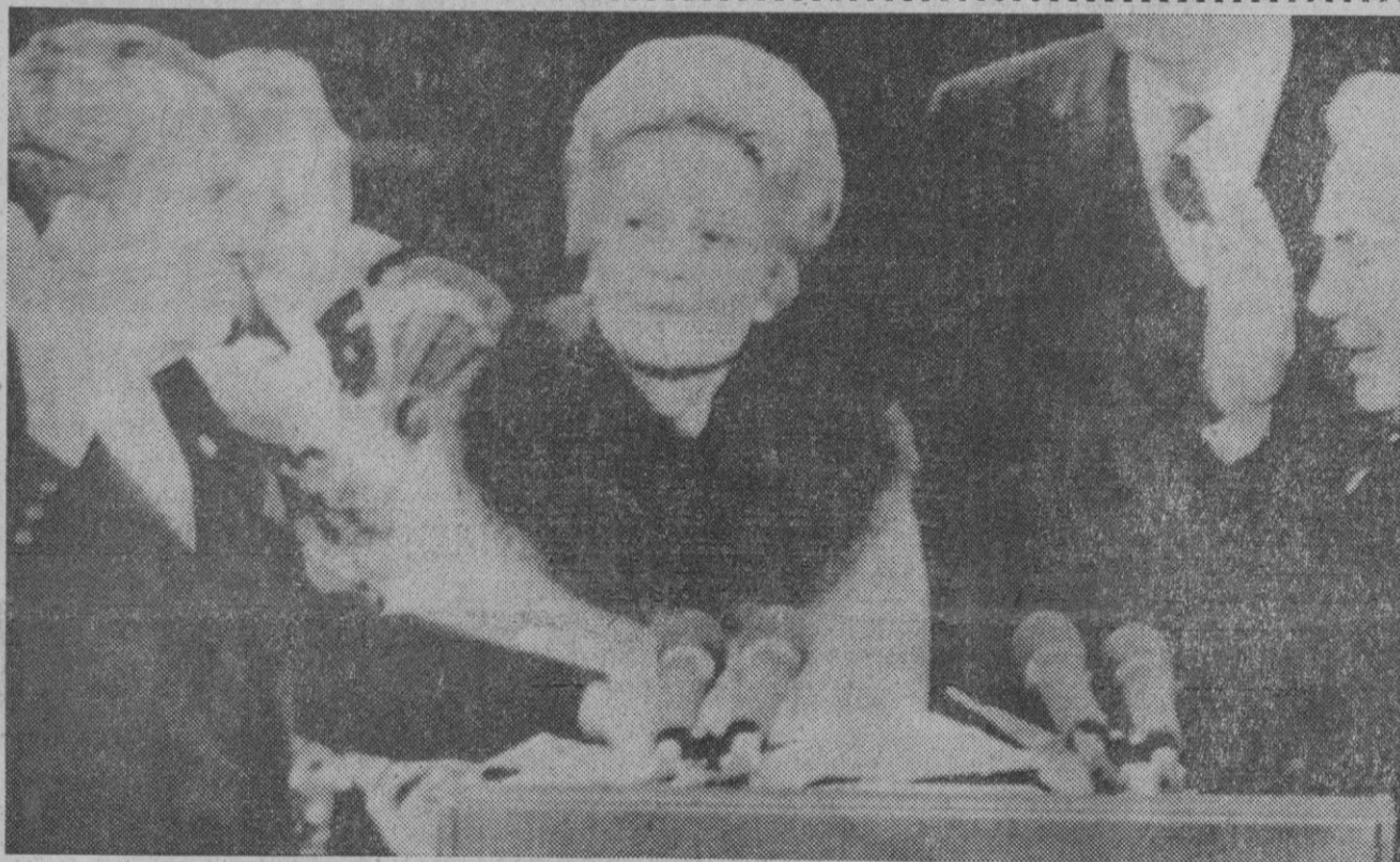
Ante la complacida sonrisa de su esposa, el Presidente Richard Nixon presta juramento sobre la Biblia en presencia del presidente del Tribunal Supremo, Warren E. Burger, durante la ceremonia de toma de posesión de su segundo mandato como Presidente de los Estados Unidos.

Copenhague, 22.—Un miembro del Parlamento sueco ha declarado hoy en esta capital, a su regreso de una visita a Hanoi, que el acuerdo de paz en Vietnam podría firmarse mañana. Al hablar en una conferencia de prensa en el aeropuerto de Copenhague, Kastrup, y en escala hacia Estocolmo, Ole Ullsten declaró lo siguiente: «En Hanoi hemos notado una serie de indicios que muestran que el acuerdo de paz para Vietnam podría ser firmado mañana en París». Ole Ullsten viajó a la capital norvietnamita en calidad de miembro de una delegación internacional que ha visitado recientemente el Vietnam del Norte.—Efe-Reuter.