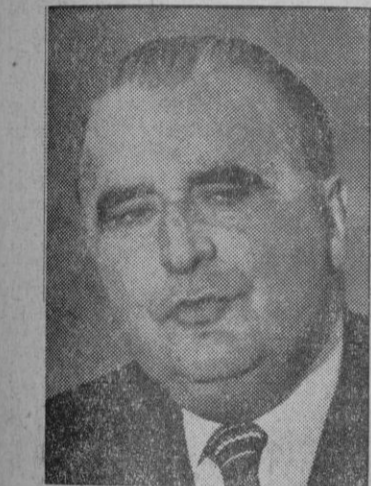
Georges Pompidou, Presidente de la República Francesa, quien se enfrenta a la posibilidad del triunfo de las izquierdas en las próximas elecciones

El diario «Al Ajjar» informó ayer que la reactivación del frente oriental de Jordania contra Israel probablemente se discutirá por el Consejo conjunto de Defensa de la Liga Árabe, que se reunirá en El Cairo el próximo sábado.—Efe.