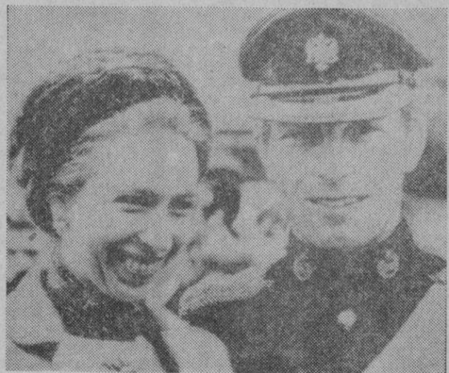
Los rumores de un posible romance entre la princesa Ana de Inglaterra y el teniente Mark Phillips, parecen confirmarse. Como se sabe, el apuesto teniente está cumpliendo con sus obligaciones militares en Alemania. Ahora se ha hecho público que la princesa visitará oficialmente Alemania el próximo mes de junio para inspeccionar los destacamentos militares ingleses en aquel país. No se duda de un encuentro allí con Phillips. En esta composición fotográfica vemos a los dos.