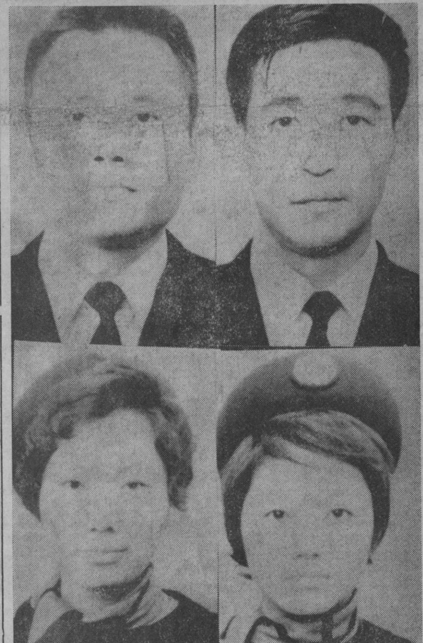
Cuatro de los catorce miembros de la tripulación del avión japonés que se ha estrellado en el aeropuerto de Moscú. Arriba, de izquierda a derecha, el capitán y el copiloto, y abajo, las dos azafatas; la de la izquierda figura entre los trece únicos supervivientes.

El conservador «The Daily Telegraph» inserta la foto de Franco dando la mano al ministro británico, y afirma que la atmósfera en El Pardo era «jovial».