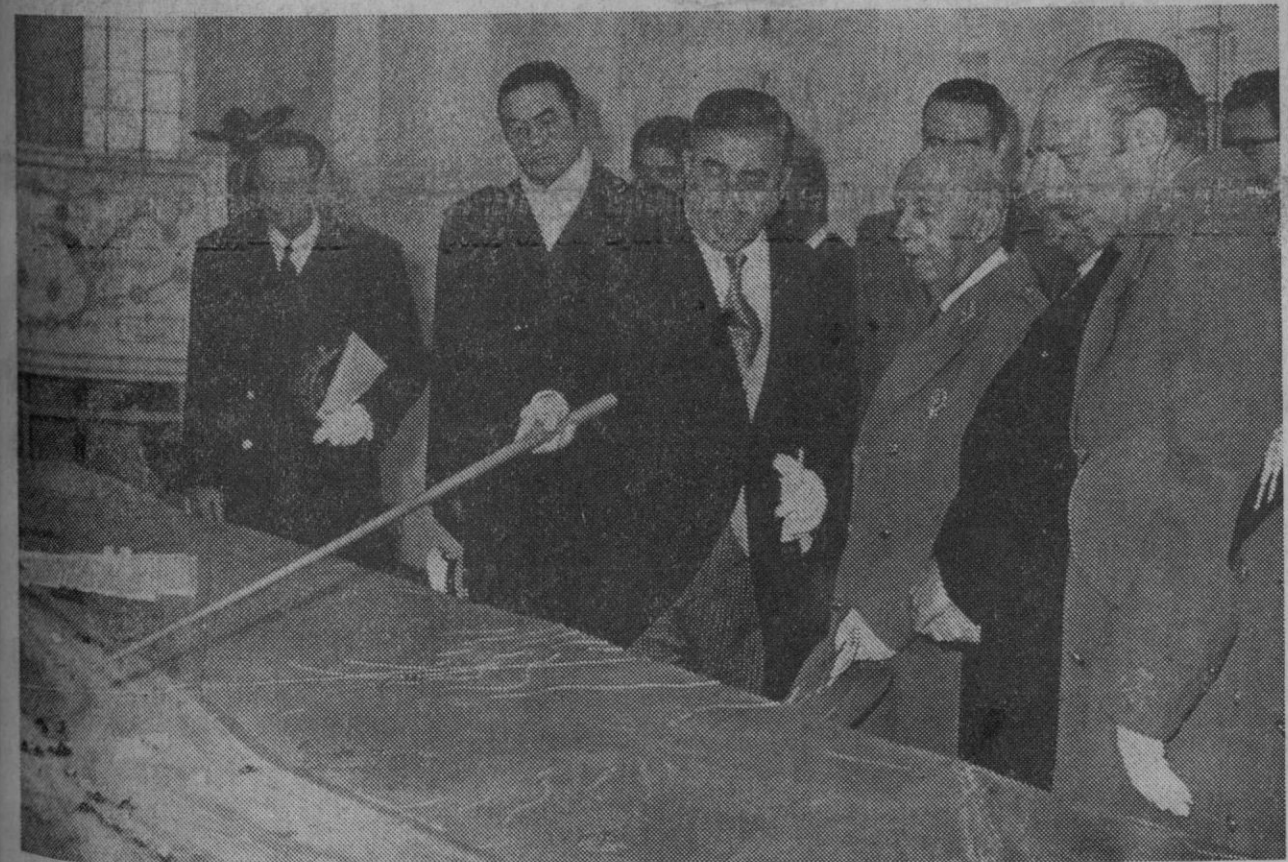
Madrid.—El Jefe del Estado, al que acompañaban los ministros de Obras Públicas, Industria y Ejército, presidente de RENFE y otras personalidades, durante el acto inaugural de la nueva estación de clasificación de Vicalvaro.—(Foto Europa Press)

3.—Discusión del tema de la creación de un organismo permanente para la seguridad y cooperación en Europa.—Efe-Upi.