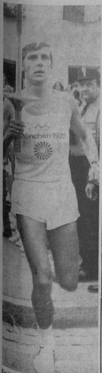
Freilassing (Alemania Federal).—Un atleta alemán porta la llama olímpica que acaba de entrar en Alemania. La llama viajará a través del sur de Alemania y llegará a Múnic el día 26 para la ceremonia de apertura de los XX Juegos Olímpicos.

Los efectos de la explosión alcanzaron a varias casas próximas al cementerio que sufrieron desperfectos en cristales de las ventanas y algunos balcones desajados.