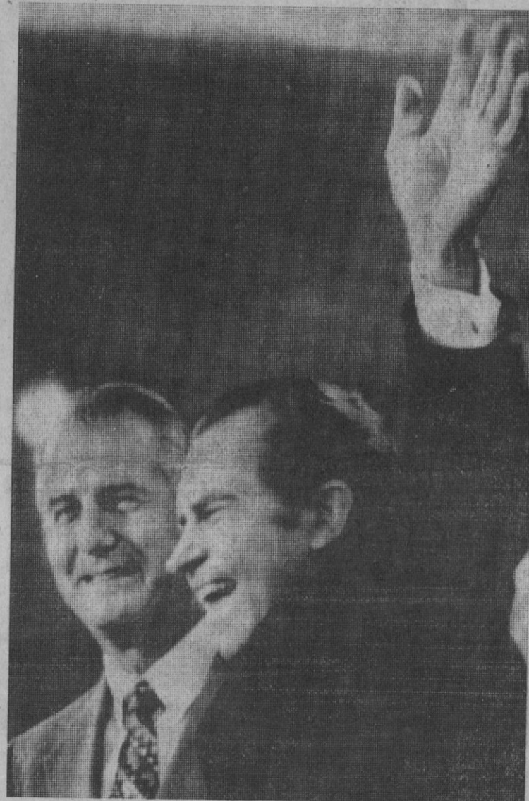
Miami Beach.—El presidente y vicepresidente de los Estados Unidos, Nixon y S. Agnew, han sido confirmados como candidatos por el partido republicano para los puestos que ocupan actualmente en las próximas elecciones presidenciales de los EE. UU.

Esta información tiene hoy amplia resonancia en los más importantes diarios italianos de todo el país. El «Corriere Della Sera» de Milán, que inserta esta noticia en su primera página, agrega los siguientes detalles: «Las indagaciones, limitadas específicamente a las descargas de petróleo en el mar, en cuanto que se trata de uno de los fenómenos más preocupantes y en alarmante expansión, han establecido que, sólo en el año 1970—año para el cual ha sido posible recoger los datos más precisos—terminaron en el mar, en total, 300.000 toneladas de petróleo. Con un litro de petróleo se vuelven biológicamente inutilizables un millón de litros de agua; de donde, las 300.000 toneladas descargadas han contaminado 300 billones de litros de agua marina.—Efe.»