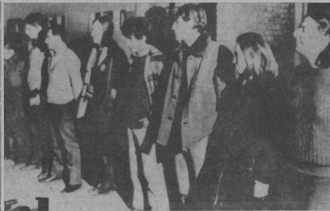
Dieciséis terroristas argentinos han encontrado la muerte en un tiroteo con fuerzas de marinería cuando intentaban escapar de la base naval Almirante Marcos Zar, situada en la Patagonia. En esta foto se ve a parte de los terroristas, tras el asalto al aeropuerto de Trelew para facilitar la fuga a seis evadidos del penal de Rawson.

hibición, establecimiento de precios que no llegan a enjugar los gastos, la competencia de otros factores, etcétera. El total de espectadores se estima que ha descendido alrededor de un 10 por 100.—E. Press.