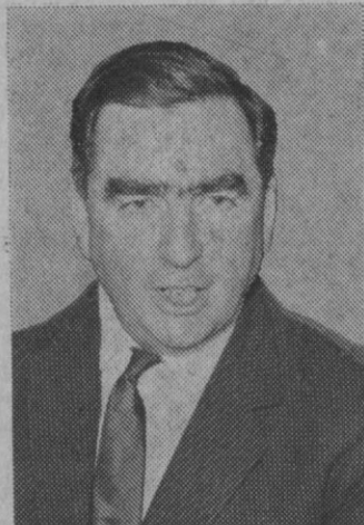
Denis Healey, político laborista británico, ministro de Finanzas del Gabinete de la oposición, que ha causado sensación al afirmar que Inglaterra devaluará la libra antes de su entrada en la Comunidad Económica Europea