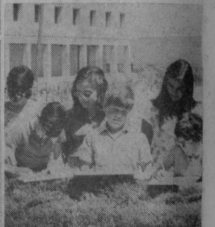
Un grupo de niños durante el concurso de dibujo al aire libre

La segunda fase del concurso infantil de pintura al aire libre se celebrará mañana, miércoles, a las 11, en la escalinata de las Sirenas.