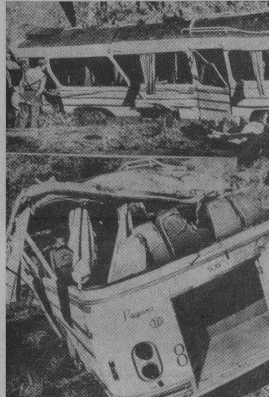
En las proximidades de Aliseda, Cáceres, un autobús se salió de la calzada y tras dar varias vueltas de campana, cayó por un terraplén de unos 40 metros. Diecinueve de sus ocupantes resultaron muertos y otros treinta y siete heridos. En las fotos, dos aspectos del vehículo tras la catástrofe.

Washington, 26.—El presidente Nixon dijo hoy que el Papa Pablo VI había supuesto una «gran ayuda» en lograr que el Gobierno de Hanoi permita un aumento de la correspondencia entre los prisioneros de la guerra norteamericanos y sus familias. Nixon hizo su declaración a través de su enviado especial ante el Vaticano, embajador Henry Cabot Lodge con quien se entrevistó hoy en la Casa Blanca. Lodge declaró también que infortunadamente el Vaticano no ha podido hacer nada en conseguir un final de la guerra en Vietnam.—Efe.