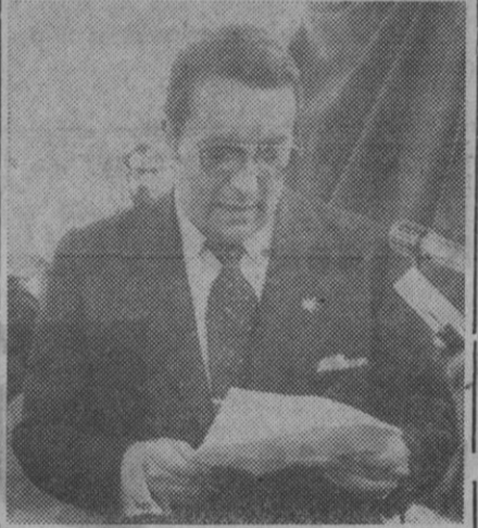
El presidente de la Diputación

Los congresistas y otras muchas personas procedentes en especial de Segovia, fueron recibidos con melo-