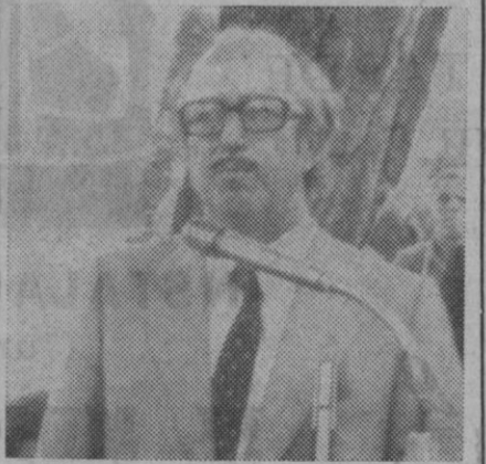
El profesor Criado de Val, presidente del Congreso

días típicas interpretadas por los dulzaineros. Todos se dirigieron a la iglesia parroquial en cuyo interior, completamente lleno de público, se desarrolló un acto literario-musical. Se repartieron unos bonitos programas con textos de cantigas de Juan Ruiz en su «Libro del Buen Amor».