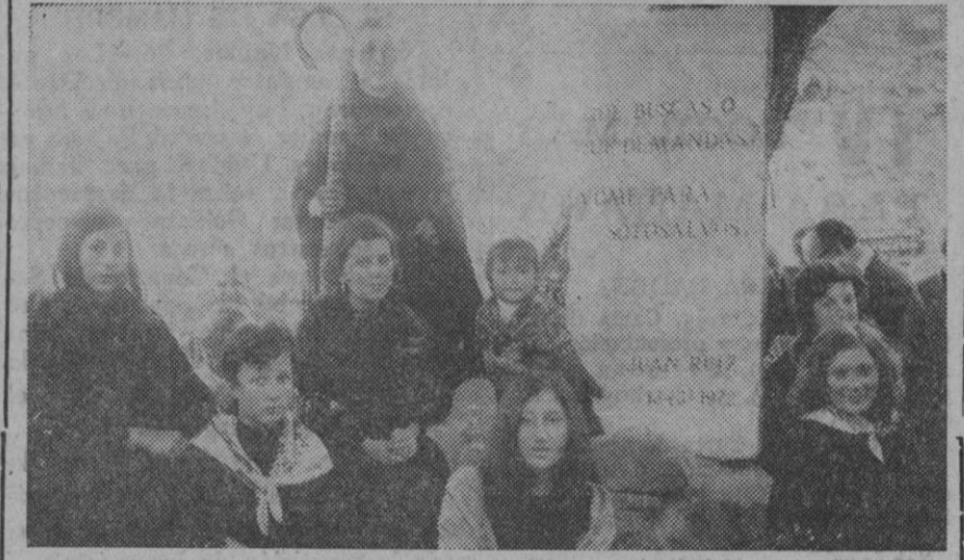
Un grupo de mozas de Sotosalbos, con trajes típicos, rodea la estela colocada junto a la fuente