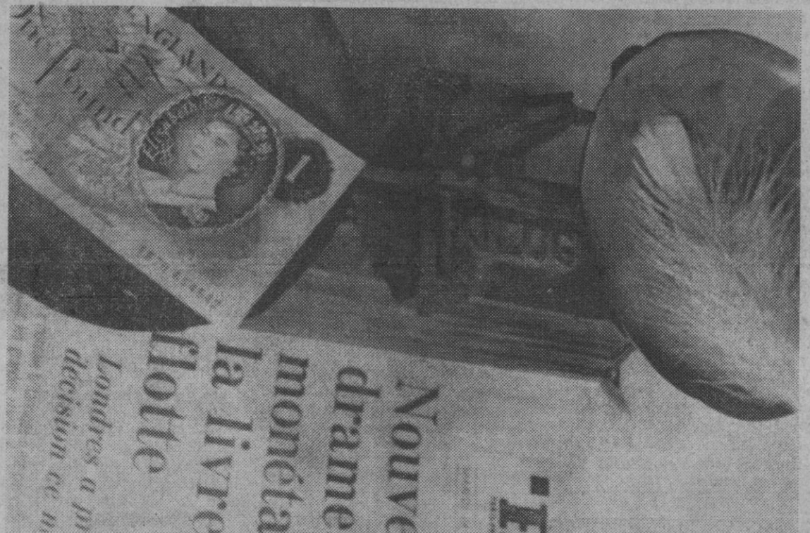
París.—Como la canción de la ópera «Rigoletto» de Verdi «La mujer se mueve, como la pluma al viento», así parece expresar la idea de la telefoto: en un platillo de la balanza la pluma, en otro la libra esterlina que flota en sus cambios. Así nos presentan la situación de la moneda inglesa actualmente.

Allon añadió que "hacemos cuanto está en nuestras manos para evitar daños a la población civil, pero a veces, de manera inintencionada, se ataca a esta población, como ha sucedido en Hasbaiya".—Efe-Reuters.