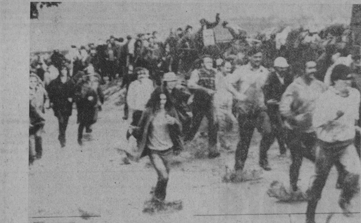
Wiles-Barre (Pennsylvania).—Obreros voluntarios que se dedicaban a reforzar con sacos de arena las orillas del río Susquehanna a su paso por esta localidad inician la desbandada al recibir órdenes de evacuar la zona del dique cuando éste empezó a desbordarse.

«Podimos comprobar que todo está devastado», dijo el presidente después de haber recorrido en helicóptero varias regiones de Pensilvania con el gobernador de aquel Estado. Miles de personas tuvieron que albergarse temporalmente en escuelas y estaciones de bomberos en espera de que las aguas retrocedan a su cauce. Efe.