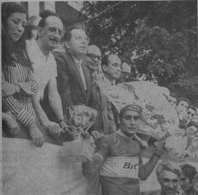
Luis Ocaña, flamante campeón, momentos después de enfundarse el jersey y de recibir el trofeo de la Federación Española de Ciclismo.

A las nueve y media de esta noche, en su espacio «Teledporte», Televisión Española ofrecerá un reportaje de la prueba ciclista celebrada ayer en nuestra ciudad.