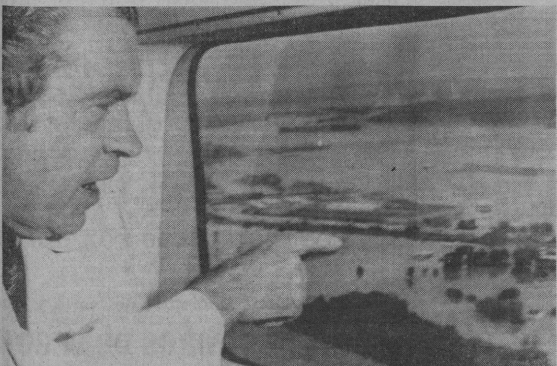
Harrisburg.—El presidente Nixon analiza los daños causados por las riadas, desde la ventanilla de su helicóptero. El presidente realizó una gira por las zonas más afectadas de los estados de Maryland y Pensylvania.

La aparición del buen tiempo se ha dejado sentir en el índice de víctimas de la carretera en Francia, que aumentó en un veinte por ciento respecto a la semana anterior.—Efe.