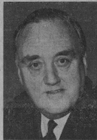
William Whitelaw, secretario de Estado británico para Irlanda del Norte, que ha rechazado la invitación de los jefes del IRA para celebrar conversaciones en busca de la paz

En los mapas del tiempo se aprecia ahora una enorme borrasca en el Atlántico Norte, y que aparece flanqueada por un cinturón de vientos de mucha intensidad. Si no fuera por el calendario y los termómetros parecería, a la vista de tales mapas, que nos encontráramos al final del invierno o comienzo de la primavera, época en que son relativamente usuales los muy grandes y muy ventosos temporales. No parece que esa borrasca vaya a visitarnos en forma inmediata, pero es probable que afecte al norte de la península, con algunos aguaceros y tormentas dispersas que pudieran llegar a algunos puntos del interior. Debe empeorar el estado de la mar en el Cantábrico, y es muy posible que Francia e Inglaterra se vean afectadas por lluvias casi generales y vientos fuertes. Por lo que respecta a las temperaturas en la península, nada tendría de particular que experimentaran un sensible descenso poco duradero mediada la semana.