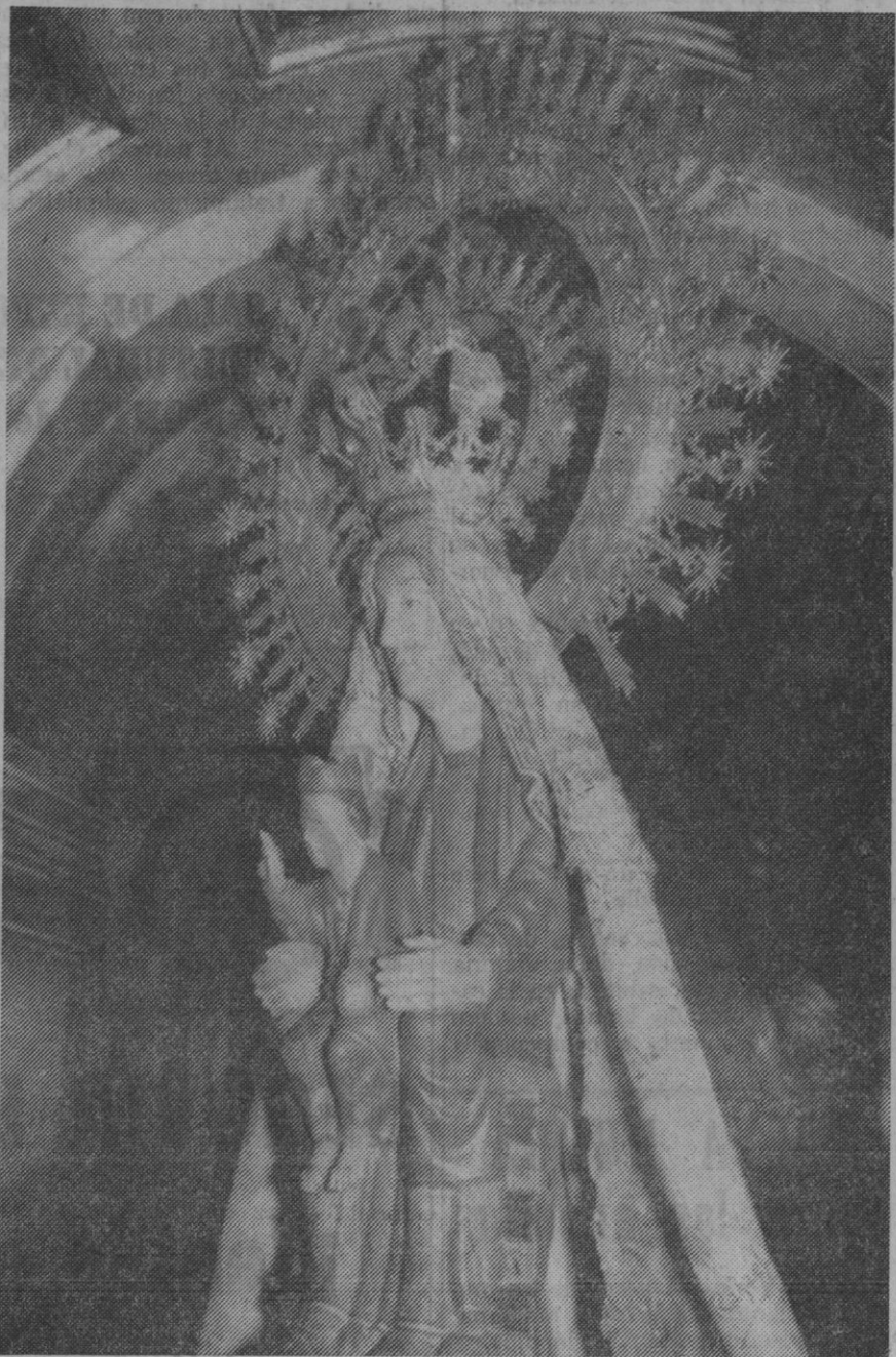
Imagen de Nuestra Señora del Henar.

La corona que hoy luce la Virgen de El Henar es obra del artífice salmantino Emilio Sánchez, discípulo de Granda; es de estilo románico y aunque es de escaso valor material, pues está constituida con oro y plata donados para este fin, sin embargo su valor artístico es grande.