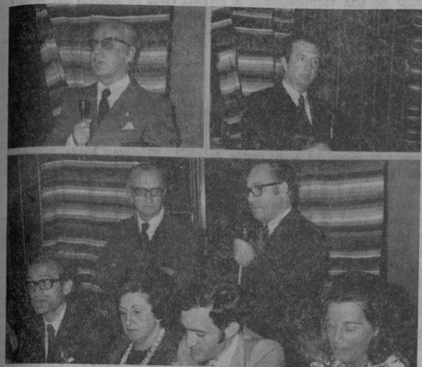
Arriba, a la izquierda, el gobernador civil; a la derecha, el director nacional de Educación y Descanso. Abajo, el cónsul de Portugal en Madrid.

San Rafael.—Durante los meses de junio a octubre, en cuyo periodo se celebrarán los siete turnos previstos, más de dos mil personas—trabajadores y sus familias—disfrutarán de sus vacaciones en la residencia que la Obra Sindical «Educación y Descanso» posee en esta localidad. Des de estos turnos, precisamente el primero y el último de la temporada inauguró oficialmente la temporada. Entre las personalidades llegadas a la residencia con este motivo, desde Segovia y Madrid figuraban el gobernador civil, cónsul de Portugal, director nacional de «Educación y Descanso», delegado y secretario de la Organización Sindical y los presidentes de los Consejos de Empresarios y Trabajadores; algunos de ellos