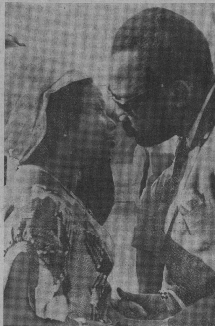
Madrid.—El general Mobutu presidente de la República de Zaire, a su llegada al aeropuerto de Madrid-Barajas, en visita privada. Fue recibido por su esposa (que había llegado por la mañana) y el ministro español de Asuntos Exteriores, señor López Bravo, y otros personalidades.