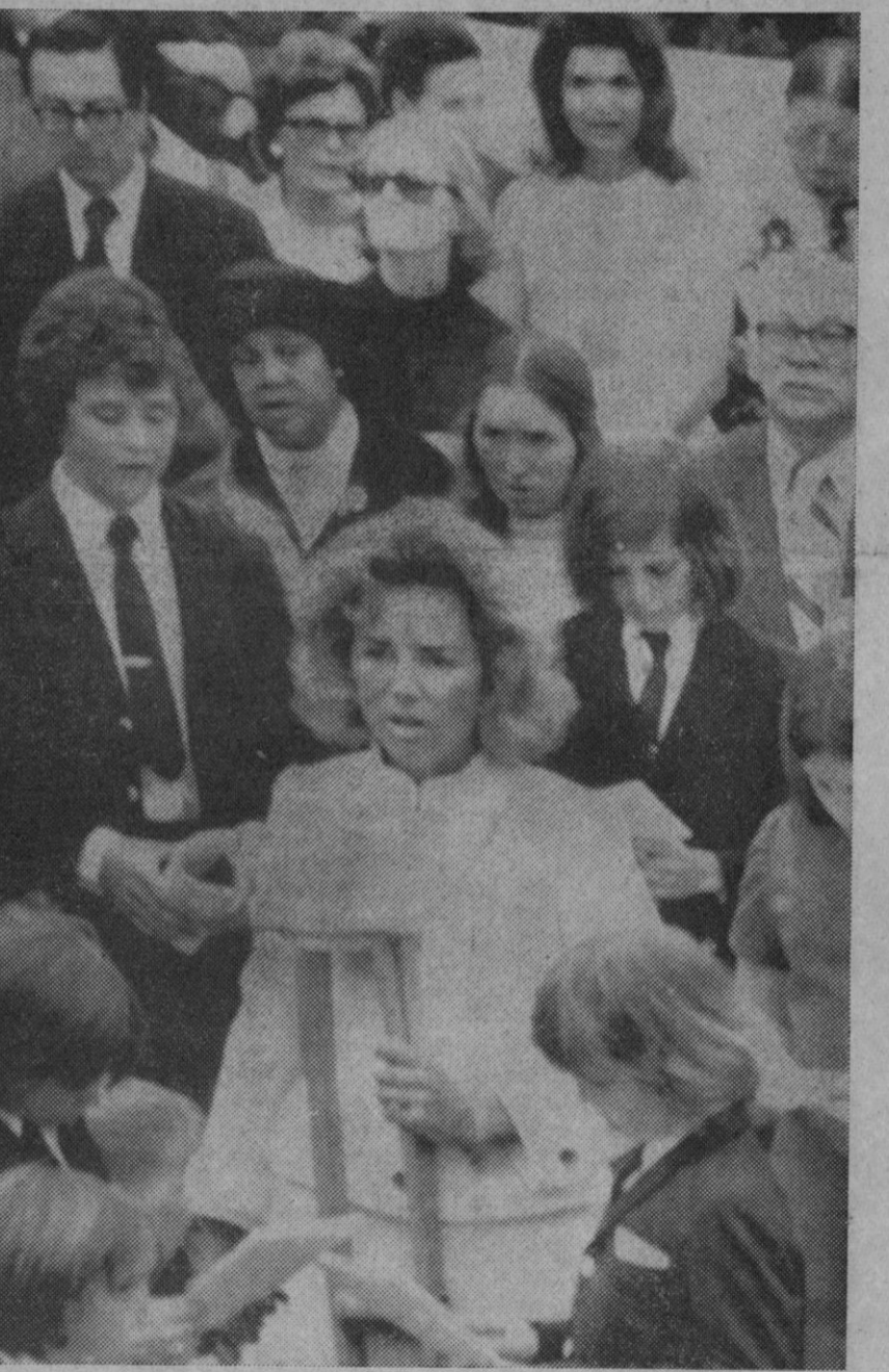
Washington.—Ethel Kennedy viuda del senador Robert Kennedy, con sus hijos, en el acto celebrado ante la tumba de su esposo en el cuarto aniversario de su asesinato. En su manos lleva las muletas que ha de utilizar debido a un reciente accidente esquiando. Al fondo, Jacqueline Onassis.