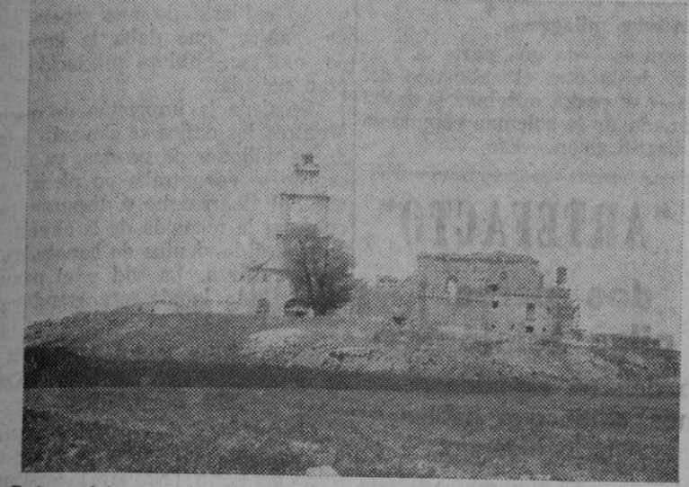
Ruinas del convento de San Francisco, de Ayllón, vistas desde la carretera que conduce a Maderuelo y pantano de Linares

Ayllón, como hemos podido constatar y ver, mira con optimismo al futuro. Su Ayuntamiento, la actual Corporación, tiene sentido de la responsabilidad y se ha conjuntado pa-