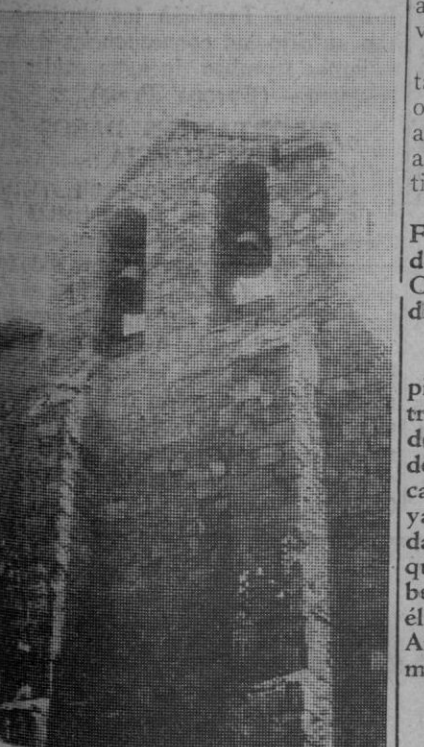
Espadaña románica de la iglesia de San Miguel

rias, dedicadas en su mayor parte a la agricultura, la ganadería y el comercio. Buen lugar de veraneo y centro turístico que aspira a su auténtica promoción, a su mayor momento en esta ruta de Somosierra.