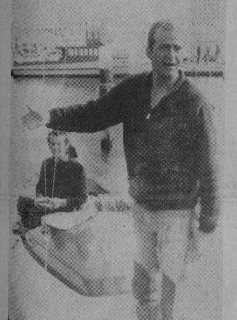
Kiel.—El Príncipe don Juan Carlos, en su yate olímpico, durante las pruebas náuticas de la semana preolímpica que vienen desarrollándose en Kiel y en las que está obteniendo una excelente clasificación.—(Telefoto AP - Europa Press)

Málaga, 7.—El ministro de Asuntos Exteriores, Gregorio López Bravo, ha llegado en avión especial a la base aérea de Málaga minutos antes de la una de la tarde. En la base fue recibido por las primeras autoridades. El señor López Bravo presidirá esta tarde la clausura del XIV Congreso Interamericano de Municipios, que se desarrolla en esta capital.—Cifra.