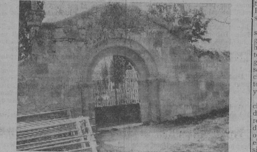
En Ayllón todo es arte, hasta la portada—románica—de acceso a su cementerio, posible resto de algún templo arruinado

Recordamos cómo los bellos ábsides románicos se conservaban bastante bien, así como que en una capilla, que carecía de cubierta en buena parte, aún existían y creemos seguirían allí varios artísticos cenota-