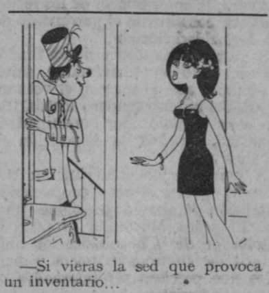
—Si vieras la sed que provoca un inventario...