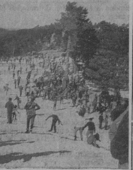
Con la ordenación de la sierra, se intentará evitar tantas aglomeraciones como ahora se producen

En principio, parece que el posible programa de actuación ha de quedar limitado a la zona del puerto de Navacerrada y su contorno. Es decir, que una primera fase de la descaída promoción afectaría a las provincias de Segovia y Madrid, y, concretamente, a algunos