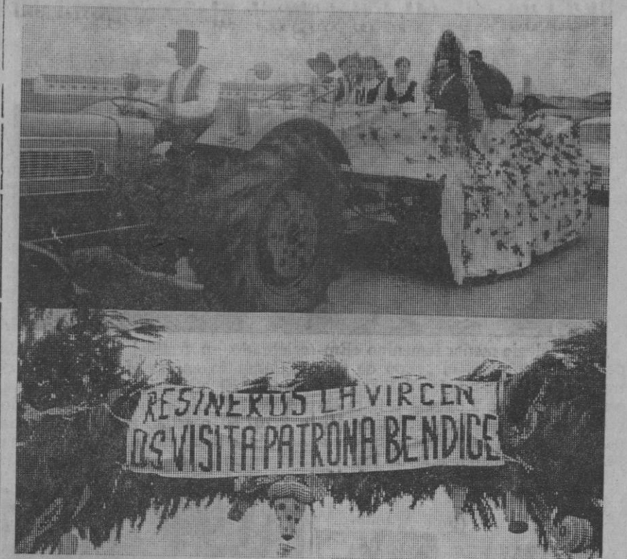
Según hemos venido informando, la imagen de la Virgen del Henar está recorriendo estos días los 41 pueblos de Segovia y Valladolid que forman la Comunidad de Cuéllar. Con este motivo, en cada localidad tienen lugar diversos actos religiosos, en los que toma parte todo el vecindario.

Ayer, con la misma solemnidad que en las jornadas precedentes, la imagen fue trasladada en procesión desde Arroyo de Cuéllar a Chañe, para continuar hoy su recorrido hacia otros pueblos hasta llegar a Cuéllar, en donde el próximo día 25 se dará por finalizada la peregrinación de la imagen por los pueblos comu-