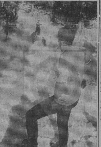
La Cruz Roja, en Navacerrada, cumple también un gran servicio en favor de miles de esquiadores

sión, en su caso, de los terrenos y construcciones de otras entidades o personas individuales que sean necesarios para los indicados fines; o llegar, si es preciso, a la expropiación forzosa, una vez que el plan sea declarado de utilidad pública.