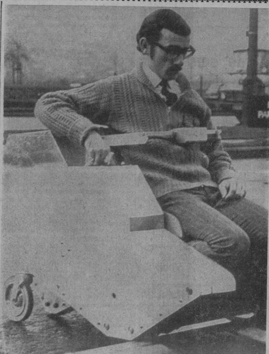
Londres.—Este es el nuevo cochecito impulsado por energía eléctrica, diseñado especialmente para niños imposibilitados por efecto de la talidomida. Lo más asombroso es que puede salvar cincuenta y escalones de hasta doce centímetros de alto. Alcanza una velocidad de tres millas por hora y tiene autonomía de diez millas. Vale 600 libras esterlinas y ha sido construido por la Reyrolle Parsons Automation en Gateshead, (Durham).

El acuerdo ha sido adoptado por la citada Corporación municipal, reunida en sesión extraordinaria, en vista de la falta de aportaciones económicas complementarias para la organización del festival musical.