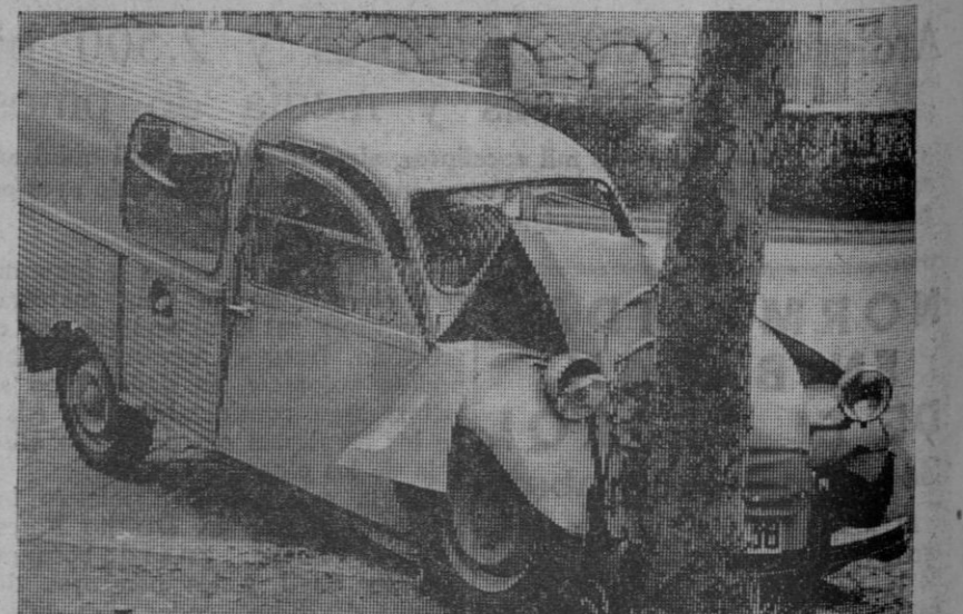
Estado en que quedó la furgoneta «víctima» del suceso ocurrido el sábado, en las primeras horas de la tarde, en la avenida del Padre Claret, del que ya informamos.