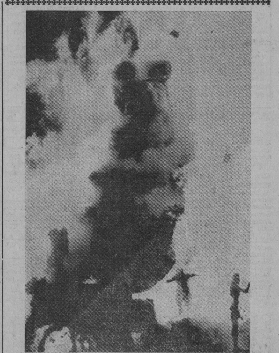
Valencia.—La falla de la plaza del Mercado envuelta en llamas durante la «Nit de Fog», La «cremá», dio fin a las alegres fiestas falleras valencianas.

Por otra parte, parece que Joe Frazier está dispuesto a medirse a Urtain, ya que, además de la sabrosa bolsa que ofrece Kent Cooke, esa pelea será una oportunidad para que el campeón del mundo prepare su revancha con Cassius Clay.—Alfil.