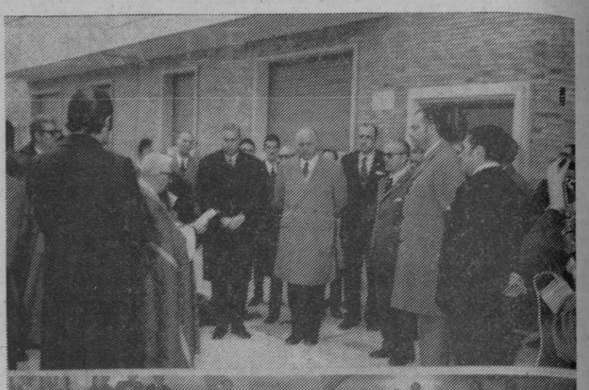
EL SINDICALISMO SEGOVIANO TE PIDE VIVIENDAS PARA NUESTROS TRABAJADORES.

VIVIENDAS SINDICALES Se refirió después a las noventa viviendas del polígono de San Millán, promovidas por la Obra Sindical del Hogar por encargo del Instituto Nacional de la Vivienda. En este sentido dijo que la entrega de la citada Obra Sindical quedaba de manifiesto una vez más, por lo que quería hacer patente su gratitud. Tuvo palabras de felicitación para