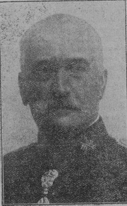
El Infante Don Carlos, nuevo Capitán General de Cataluña.

Al saludo dirigido por el P. Garagnani, S. J., respondió el Pontífice con un discurso en el cual agradeció la hermosa manifestación que hacían las Congrega-