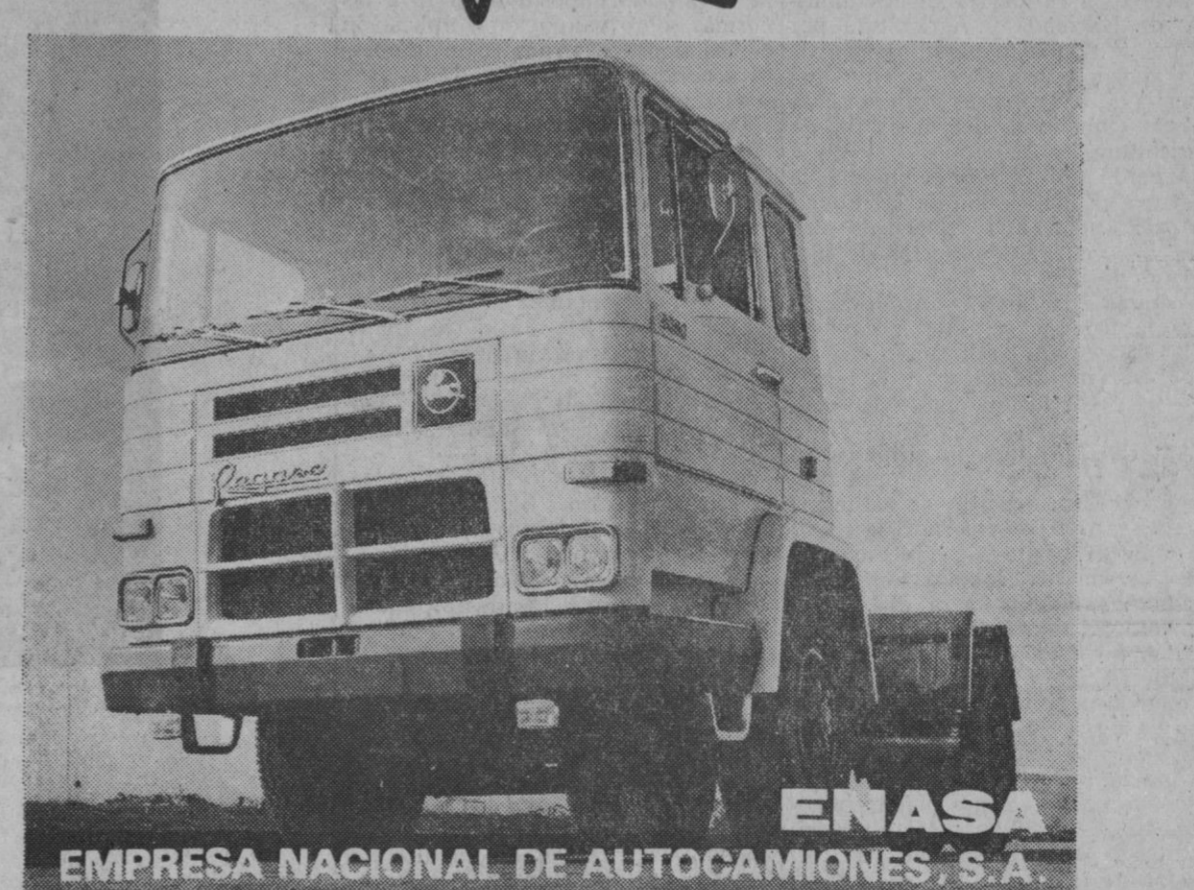
EMPRESA NACIONAL DE AUTOCAMIONES S.A.