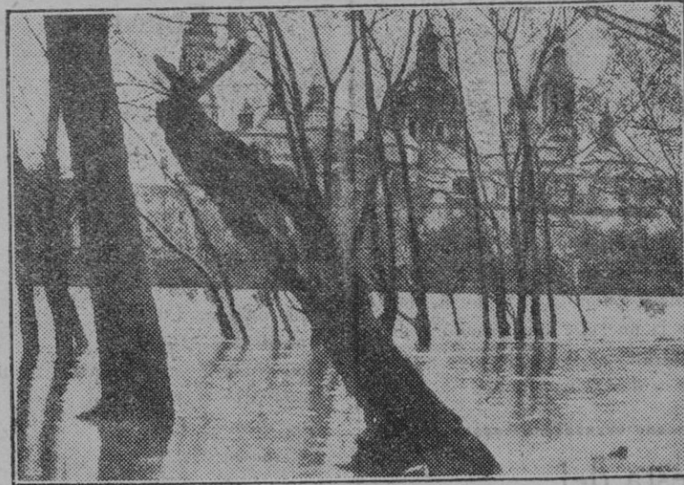
Zaragoza. — Perspectiva que ofrecían las riberas del Ebro inundadas a consecuencia de la crecida que elevó a cinco metros el nivel del río. Al fondo, las torres de Templo del Pilar.