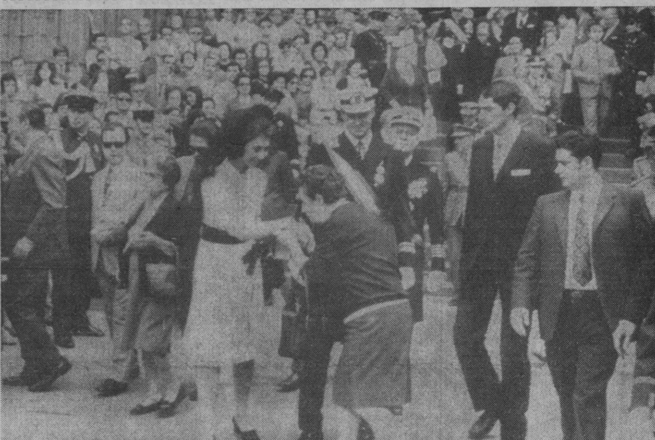
Barcelona.—Una señora de edad se acerca a besar la mano de la Princesa Sofía, a la salida de los Príncipes de España de la catedral de Barcelona, donde se ofició un solemne pontifical en el IV Centenario de la batalla de Lepanto.

ahora la importancia del valor de las pérdidas ocasionadas.—Cifra.