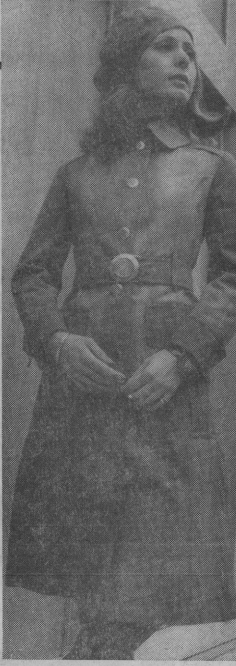
En un artículo de mezcla de poliéster y algodón «decolorado» en tonalidades kakis. Botones y hebilla metálica. (Modelo Ponseti-Condal)