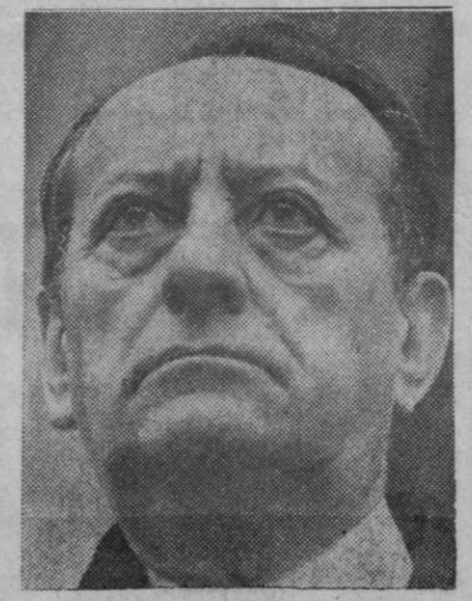
André Malraux, el célebre escritor francés, antiguo ministro de Cultura, que ha declarado estar dispuesto a combatir, como voluntario, al lado de Bangla Desh, partisanos de la liberación del Pakistán Oriental

Al respecto, ha sido hoy recordado a la asamblea que para el debate sobre la parte práctica del ministerio sacerdotal se consideran en vigor las disposiciones ya conocidas: intervenciones de ocho minutos, en latín