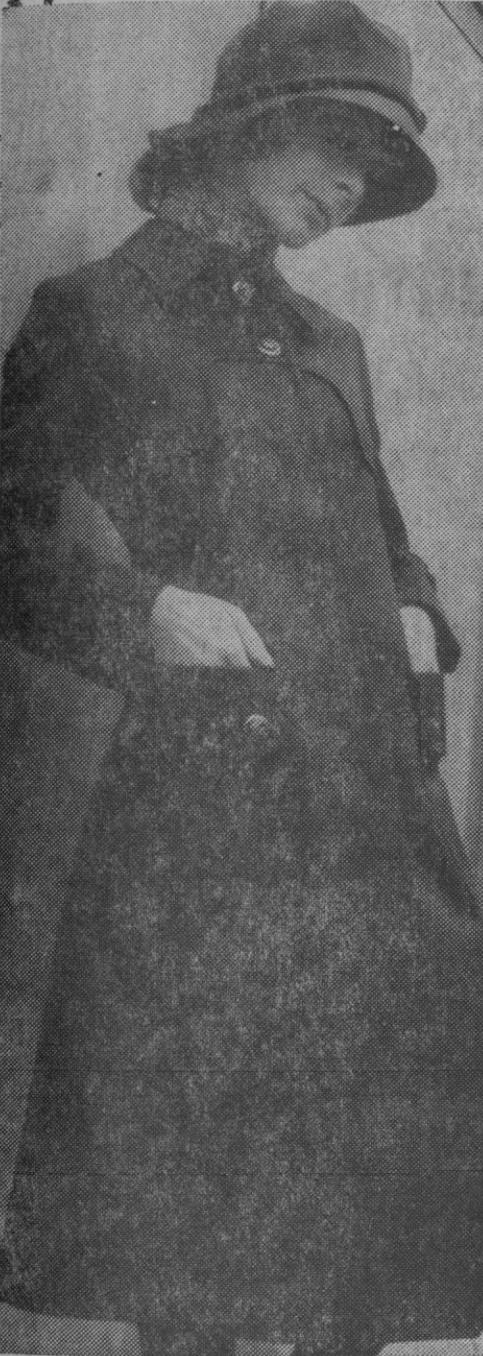
Un simple y elegante impermeable, ajustado al cuerpo y falda «évasee», con el único adorno del canesú y los botones de cuero y metal. (Un diseño de Ponseti, para Condal)