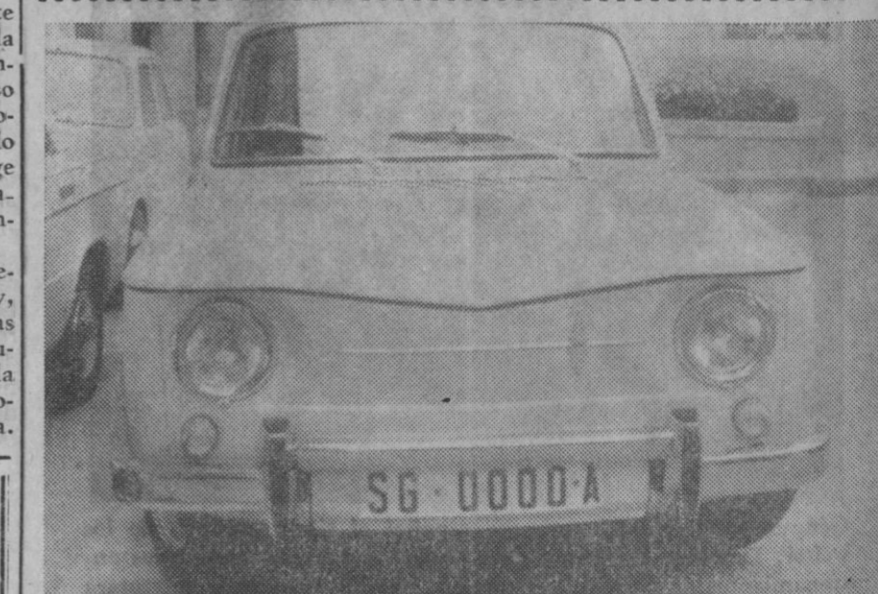
Este es el nuevo modelo de matrícula para vehículos, cuyo primer número se dio ayer por la Jefatura Provincial de Tráfico, según ya informamos, a este turismo. Las matrículas sucesivas irán con los números ordinales hasta el 9.999 con la letra A, continuando después según las normas hechas públicas recientemente.

Salve en la Fuencisla. A partir de mañana, todos los sábados y hasta nuevo aviso, la salve en el santuario de la Fuencisla será a las cinco y media de la tarde, con rosario, salve e himno. Queda suprimida la misa que hasta ahora se venía celebrando.