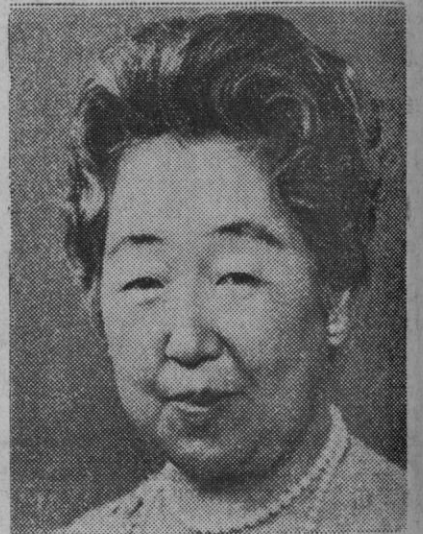
La emperatriz japonesa Nagako quien, acompañada de su esposo, el emperador Hiro Hito, se encuentra realizando un viaje por Europa

El texto de la proclama de la Semana de España señala que cerca de un millón de «leales y patriotas ciudadanos de origen hispano han hecho de Nueva York su casa, convirtiéndola en una de las mayores ciudades del mundo de habla española». —Efe.