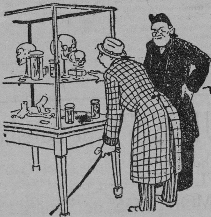
EN EL MUSEO

La "Asociación de Cultura Musical", que, durante este invierno, ha hecho desfilar por su Sala de conciertos a artistas tan brillantes como Raya y Lydia Garbousova, el Cuarteto Balga y Miguel Llobet, ha confiado su VI. Concierto