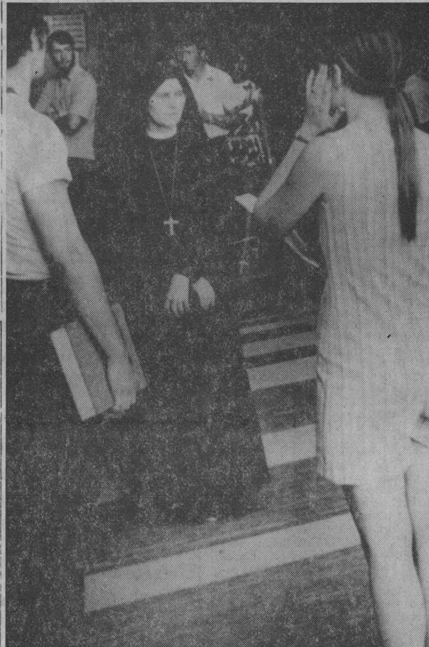
Ciudad del Vaticano.—Una monja en la entrada de la basílica de San Pedro no permite la entrada a una joven en short. Ha sido una medida del Vaticano para la campaña contra la inmoralidad.