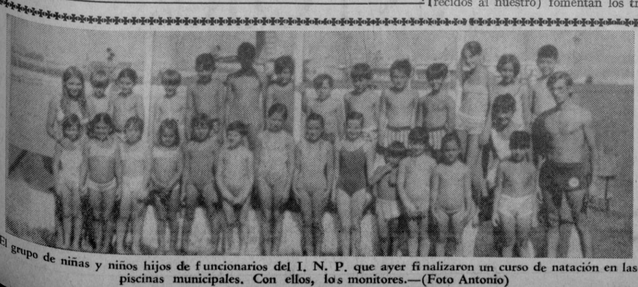
El grupo de niñas y niños hijos de funcionarios del I. N. P. que ayer finalizaron un curso de natación en las piscinas municipales. Con ellos, los monitores.

Equipos: SIZAM de MADRID y SANTA FE de VALLECAS