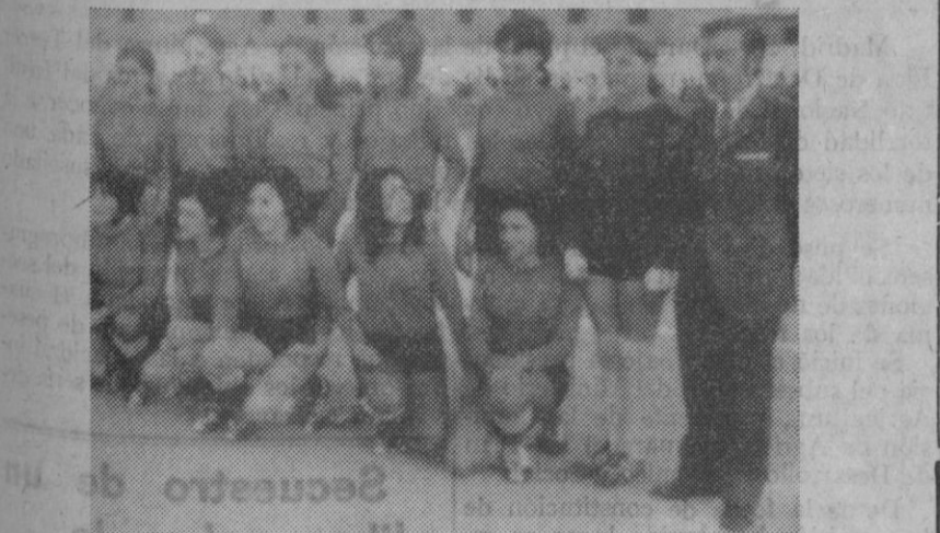
En la fotografía superior, el Sizam; en la inferior, el Santa Fe