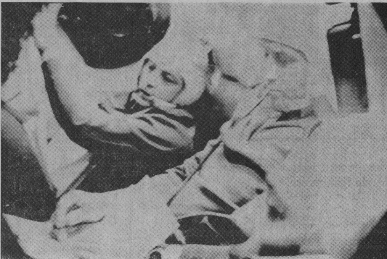
Moscú.—Una vista del interior de la nave «Soyuz 11» que con tres astronautas soviéticos a bordo ha sido lanzada desde el cosmódromo de Baikonur. Desde la izquierda: el ingeniero V Volkov; comandante G. Dobrovosky y el ingeniero de pruebas V. Patsaev.

y Turismo—dijo—está también al servicio de este nuevo horizonte y (Continúa en la página 4)