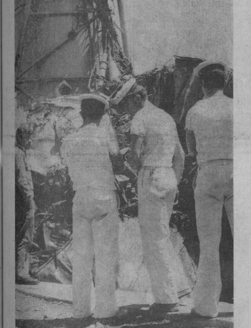
Cartagena.—A sesenta millas de la costa de Cartagena entraron en colisión un buque de guerra francés y un petrolero ruso, el “Surcouf” y el “Boucharov”. Nueve marineros del buque francés resultaron muertos y el “Surcouf” fue llevado al puerto de Cartagena por un remolcador español.