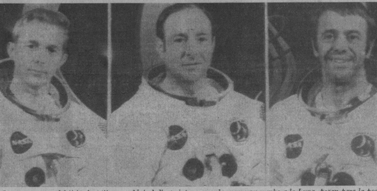
Los astronautas del "Apolo 14" que saldrá el día treinta y uno de enero con rumbo a la Luna, posan para la posteridad con sus trajes espaciales. Desde la izquierda: Stuard Roosa, Edgar Mitchell, y el comandante Alan Shepard.

El presidente del Comité de Relaciones Exteriores del Senado, Edgar J. Hoover, dijo que el Príncipe de España es una persona que puede ser lanzada al mundo y representar las opiniones, los deseos y la mentalidad de todos ellos, teniendo en cuenta siempre cuáles han de ser sus funciones como futuro Rey de España.