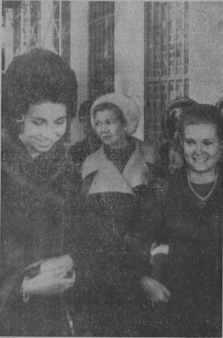
Washington.—Patricia Nixon, hija del presidente Nixon, acompañada a la princesa doña Sofía en su visita a las obras del centro de artes "John F. Kennedy", en Washington.

Madrid, 28.—El Consejo del Reino se ha reunido la mañana de hoy, bajo la presidencia del titular de las Cortes y del Consejo, don Alejandro Rodríguez de Valcárcel. En fuentes competentes se ha podido saber que la reunión ha tenido por objeto dar posesión de sus cargos a los nuevos miembros de la ponencia de Contrafueros.—Cifra.