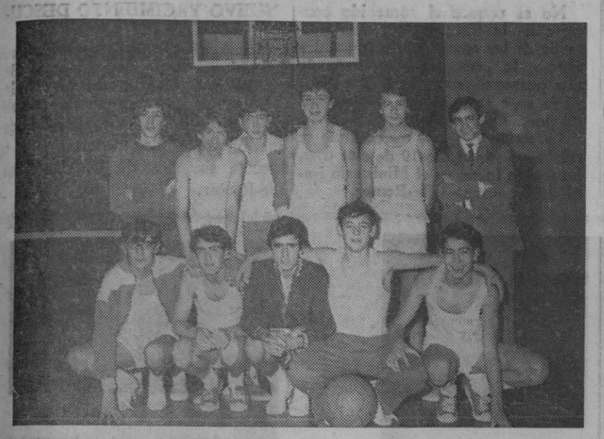
Equipo "A" del O. A. R.