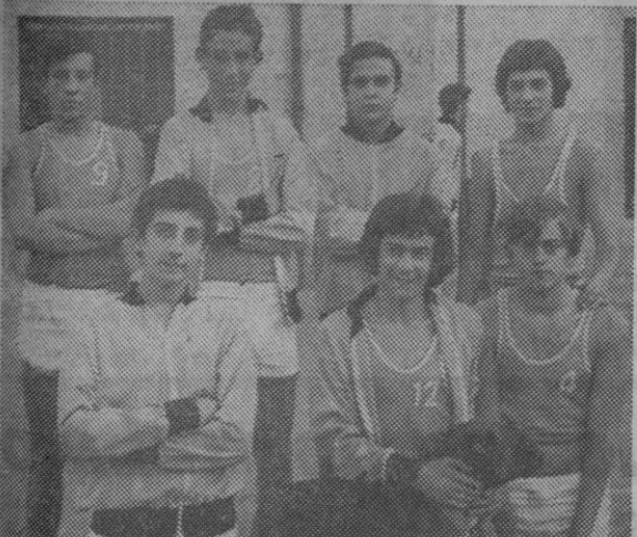
Equipo juvenil del Eresma