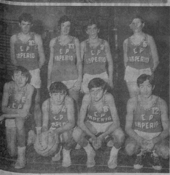
Equipo juvenil del Imperio OJE

Resultados de los partidos correspondientes a los campeonatos provinciales Categoría femenina: Jesuitinas A, 42; Imperio OJE, 17. Jesuitinas B, 9; Magisterio, 12. Categoría juvenil: Eresma G. F., 71; O. A. R., «A», 22. Magisterio, 21; Imperio, 16. O. A. R., «B», 10; Maristas, 35. Categoría junior: Imperio OJE, 31; Eresma B, 20. O. A. R., 10; Eresma A, 15. Categoría senior: D. A. S., 20; Magisterio, 17.