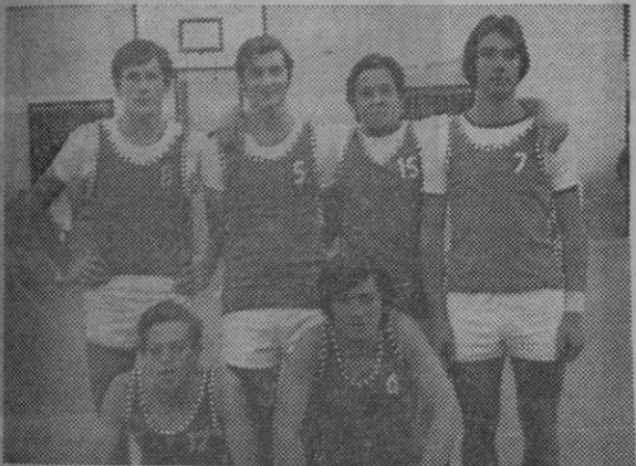
Equipo "junior A" del Eresma