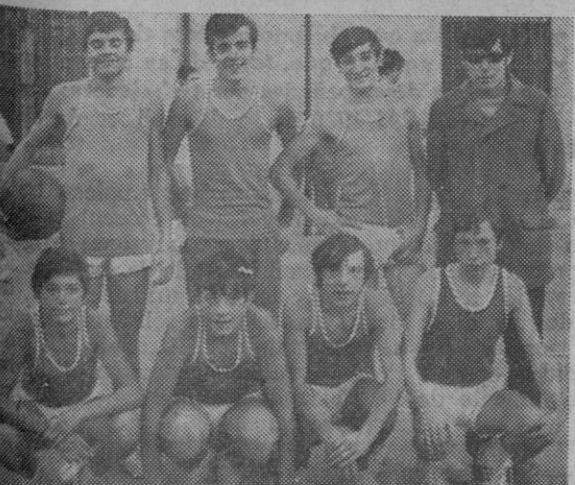
Equipo juvenil "B" del O. A. R.