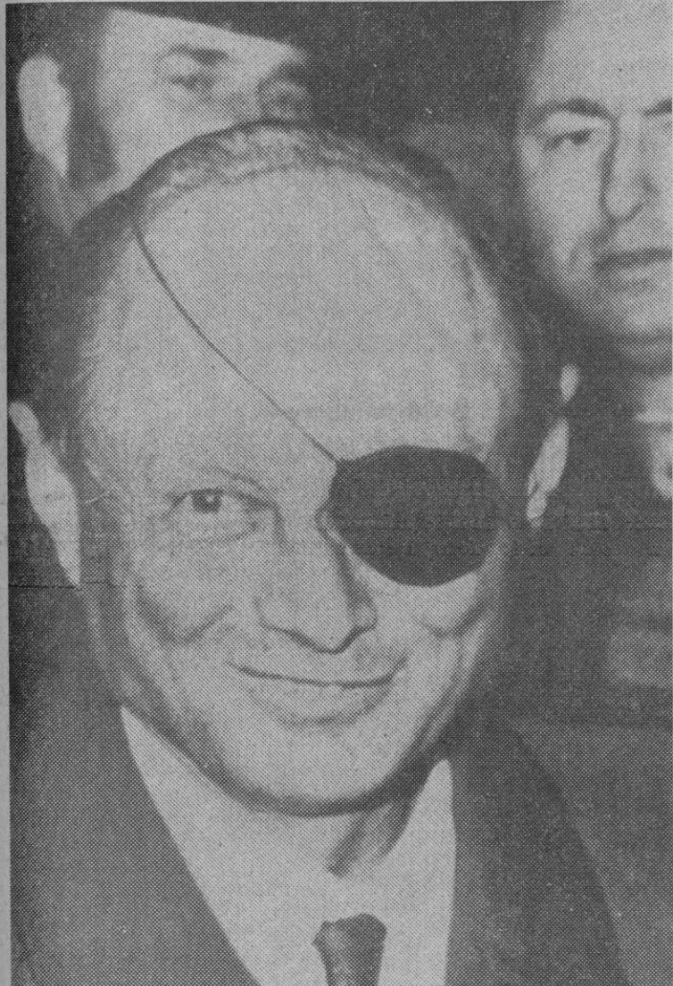
Nueva York.—El ministro israelí de Defensa, Moshe Dayan, sonríe a su llegada al aeropuerto Kennedy, de Nueva York, poco antes de emprender viaje a Washington donde celebrará conversaciones de alto nivel sobre la posibilidad de reanudar las conversaciones de paz con Egipto.

Las temperaturas extremas de España; máxima de 19 grados en Castellón y mínima de un grado bajo cero en Avila y Ciudad Real.