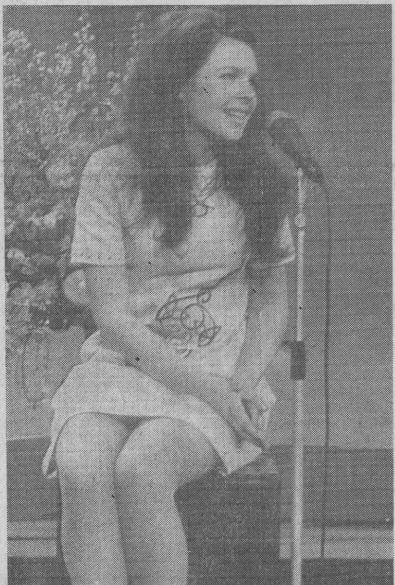
Amsterdam (Holanda).—Esta es Dana, irlandesa, 18 años, triunfadora del Festival Eurovisión 1970. Su canción, "All kinds of everything".

En el pasado mes de enero el Gobierno dejó sin efecto la disposición que no permitía sacar más de 50 libras del país a los turistas, preocupado por su creciente impopularidad. Este año los turistas británicos tienen autorizado sacar hasta 300 libras para sus vacaciones.—Efe.