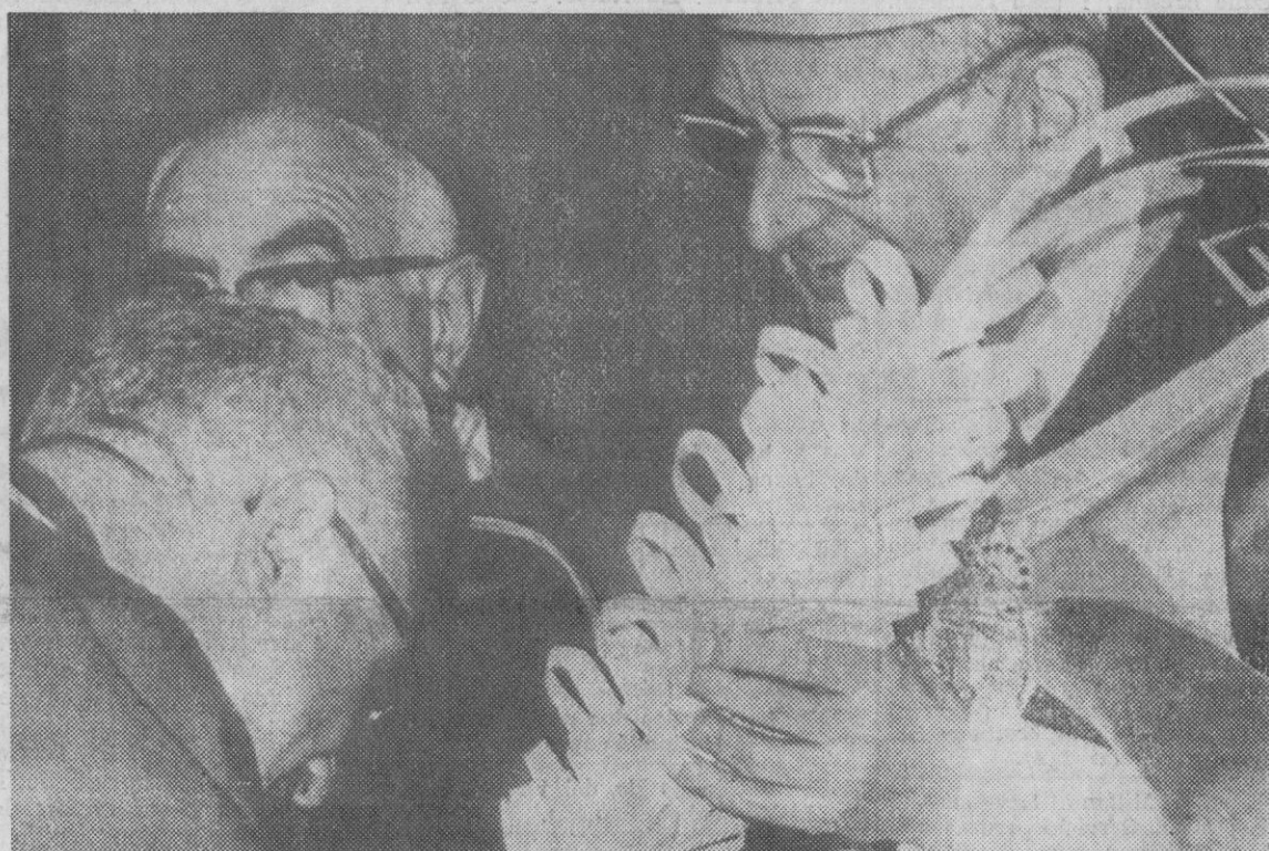
Vaticano.—Pablo VI entrega una palma al cardenal Felici, de Italia. La palma había sido bendecida en la tradicional ceremonia del Domingo de Ramos, que tuvo lugar en el pórtico de la basílica de San Pedro.