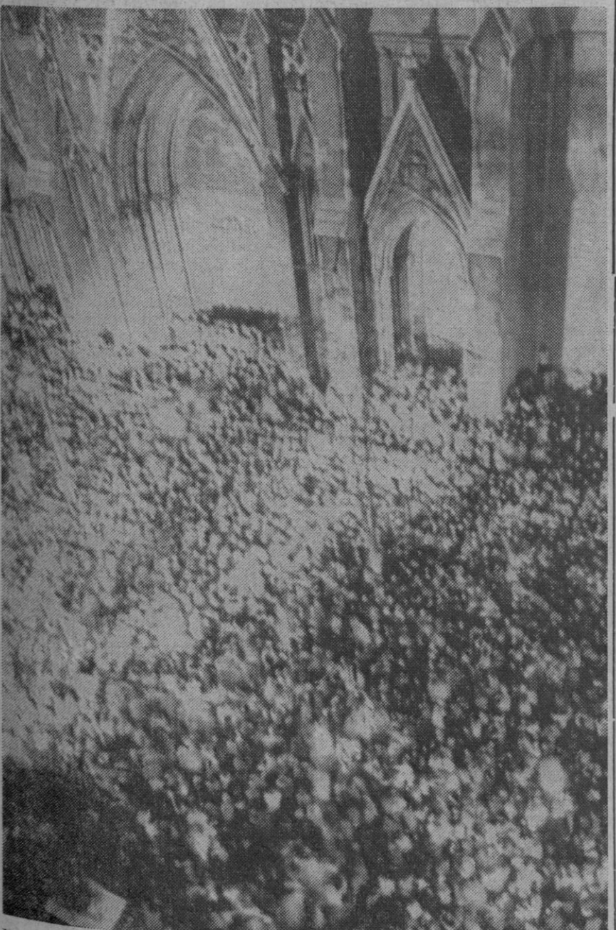
Nueva York.—Una ingente multitud se congregó ante la catedral de San Patricio, en Nueva York, para escuchar discursos e himnos musicales durante el día de la gran moratoria contra la guerra del Vietnam.

«en frío» en un compartimento sin presión. Por lo que se conoce, la «Soyuz 6» no ha realizado intentos de unirse con las otras dos cápsulas soviéticas, que siguen aún en órbita.—Efe-Upi.