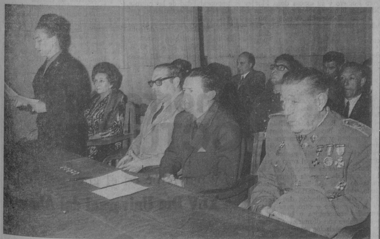
Santa Teresa es Patrona de la Sección Femenina, que ayer —como informamos— celebró diversos actos con tal motivo. En la fotografía, la delegada provincial, acompañada de autoridades, personalidades y jerarquías, en el momento de su intervención en el acto público celebrado ayer en la Delegación Provincial.

En el DOMUND DE LA JUVENTUD ¿Tú qué vas a dar? ¿Quedarás tranquilo con entregar un poco de calderilla ante las necesidades inmensas de la empresa misionera de la Iglesia?