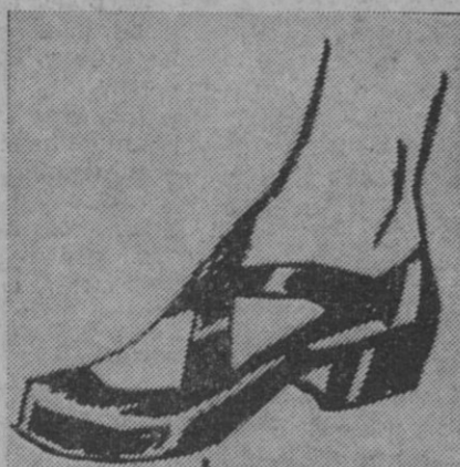
Zapato en charol negro y color

París sede por autonomía de la elegancia, por más que algunos otros países europeos quieran quitarle un cetro respaldado por un prestigio de muchísimos años, ha dado la medida de la importancia del calzado esta temporada en la presentación de fa-