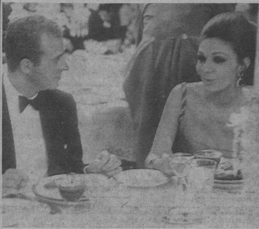
Teherán.—El Príncipe de España, don Juan Carlos de Borbón, con la emperatriz del Irán, durante la cena que les fue ofrecida por el príncipe Guelam Reza.

Obra Sindical de Educación y Descanso. Agradecemos cordialmente vuestra devota visita. Pedimos a Dios que en vuestras actividades os sepáis comportar siempre como cristianos auténticos, fieles y valientes, como miembros honrados y responsables de la sociedad en que vivís». El Sumo Pontífice concluyó su saludo afirmando: «Con estos deseos os otorgamos una especial bendición apostólica que extendemos a vuestros hogares y compañeros de trabajo».—Efe.