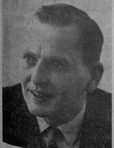
Olof Palme, nuevo primer ministro en Suecia