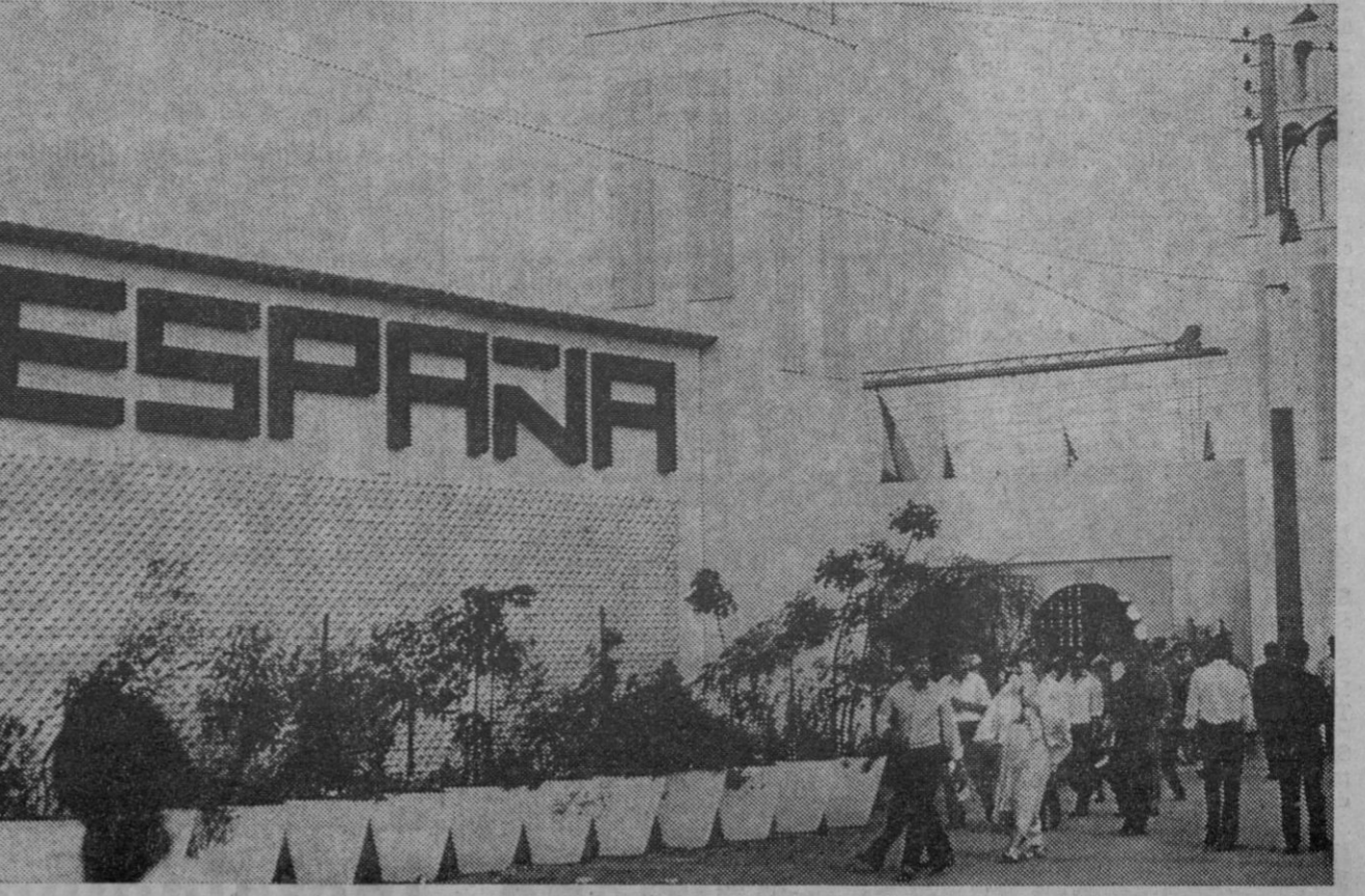
Argel.—La foto muestra la entrada principal del pabellón de España en la VI FERIA INTERNACIONAL de Argel que ha sido clausurada. La extensión de dicho pabellón era de mil doscientos metros cuadrados, lo que representa el cuarto lugar después de los de la U. R. S. S., Alemania del Este, e Italia. El volumen de ventas ha supuesto un ochenta por ciento de aumento con respecto a la edición de mil novecientos sesenta y ocho.

El abogado tenía intención de perder los trescientos dólares de una vez y luego ponerle pleito al Estado y al fiscal bajo una antigua ley de 1881.