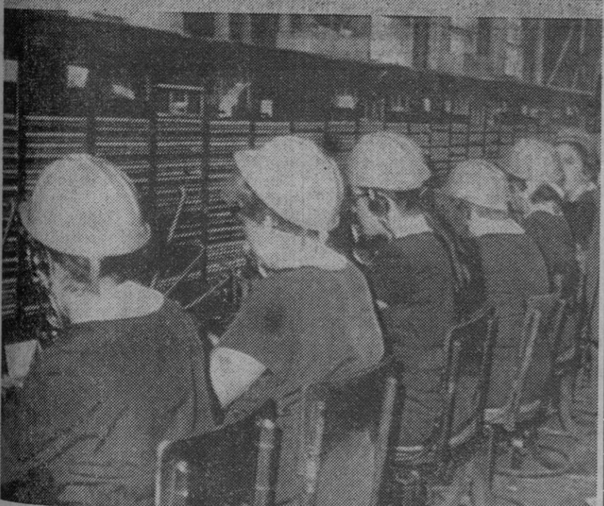
Sevilla.—Arriba: el cuadro interurbano de la central telefónica de la calle Luis Montoto, de Sevilla, que quedó destruido por un incendio. Abajo: las empleadas, protegiéndose con cascos de la posible caída de vocotes del techo, siguen trabajando una vez sofocado el siniestro.