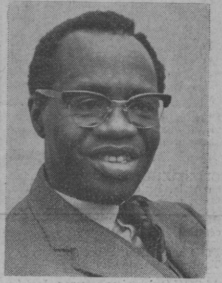
Beji Busia, nuevo primer ministro de Ghana, quien pretende volver al país al régimen democrático

A 7.499.989 dólares asciende el volumen total de las exportaciones efectuadas por la industria textil lanera española en los seis primeros meses del año en curso, lo que representa un aumento del 27,4 por ciento sobre dichas ventas al exterior, en igual periodo del año 1968, informa el Banco Exterior.