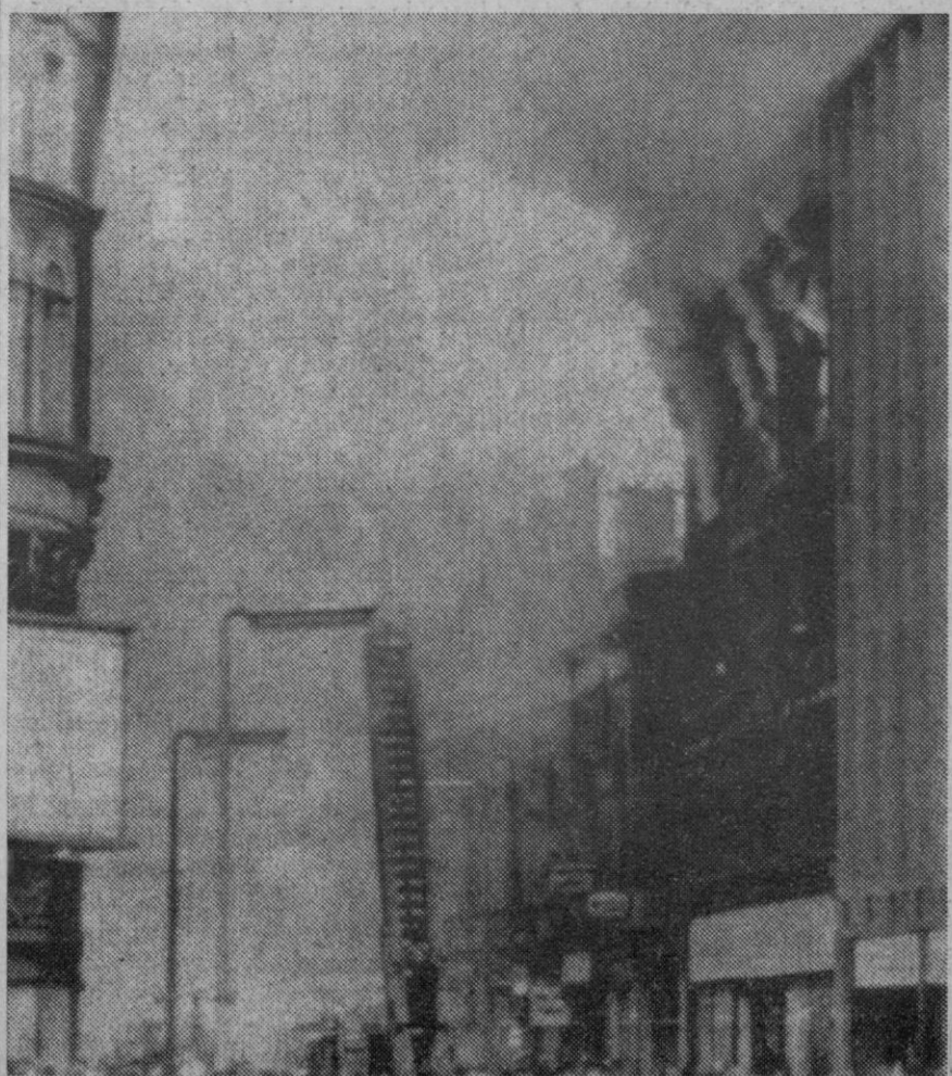
Belfast (Irlanda del Norte).—Un edificio de la Royal Avenue se ve envuelto en llamas, en un incendio provocado con motivo de los disturbios que enfrentan a católicos y protestantes.

Belfast (Irlanda del Norte), 13.—Poco después de las dos de la madrugada la policía local y los soldados británicos se vieron obligados a intervenir para evitar que varios grupos formados por más de 500 excitados protestantes entraran en el barrio católico todavía protegido por las barricadas.