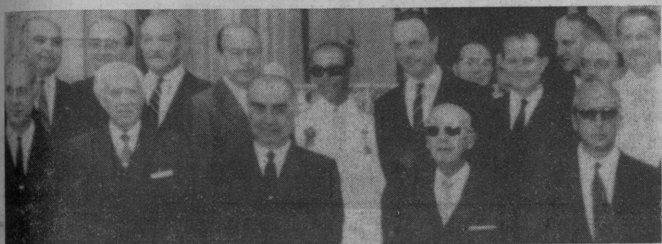
San Sebastián, 13.—El Jefe del Estado aparece rodeado de los ministros del Gobierno momentos antes de comenzar, en la mañana de ayer, el Consejo de ministros que ha finalizado hoy.

San Sebastián, 13.—Trece horas duró el Consejo de ministros que comenzó ayer, a las once menos cuarto, en el palacio de Ayete, bajo la presidencia del Jefe del Estado. Interrumpido anoche, pasadas las diez, el Consejo volvió a reanudar sus tareas cerca de las diez y media de hoy, para terminar a la una de la tarde. Poco después, el titular de la cartera de Información y Turismo, D. Manuel Fraga Iribarne, recibía a los periodistas en la sede de la Delegación provincial de su departamento para ampliarles la referencia del Consejo.