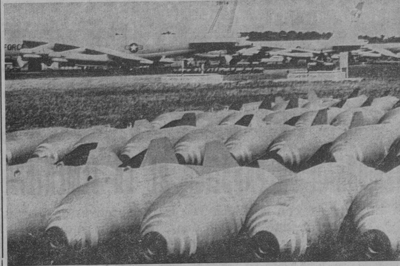
Un arsenal de bombas de aviación aparecen en el suelo en una de las bases de los bombarderos americanos en Vietnam, la base de Guan. El presidente de los Estados Unidos, Richard Nixon, ha ordenado el inmediato corte de los bombardeos sobre el Norte, un paso más en la desescalada de la guerra.

Como se ha dicho reiteradamente, al Consejo iban temas de tanta importancia como la ley sindical, la ley de educación y es lógico que fuera planeado el asunto Matesa.