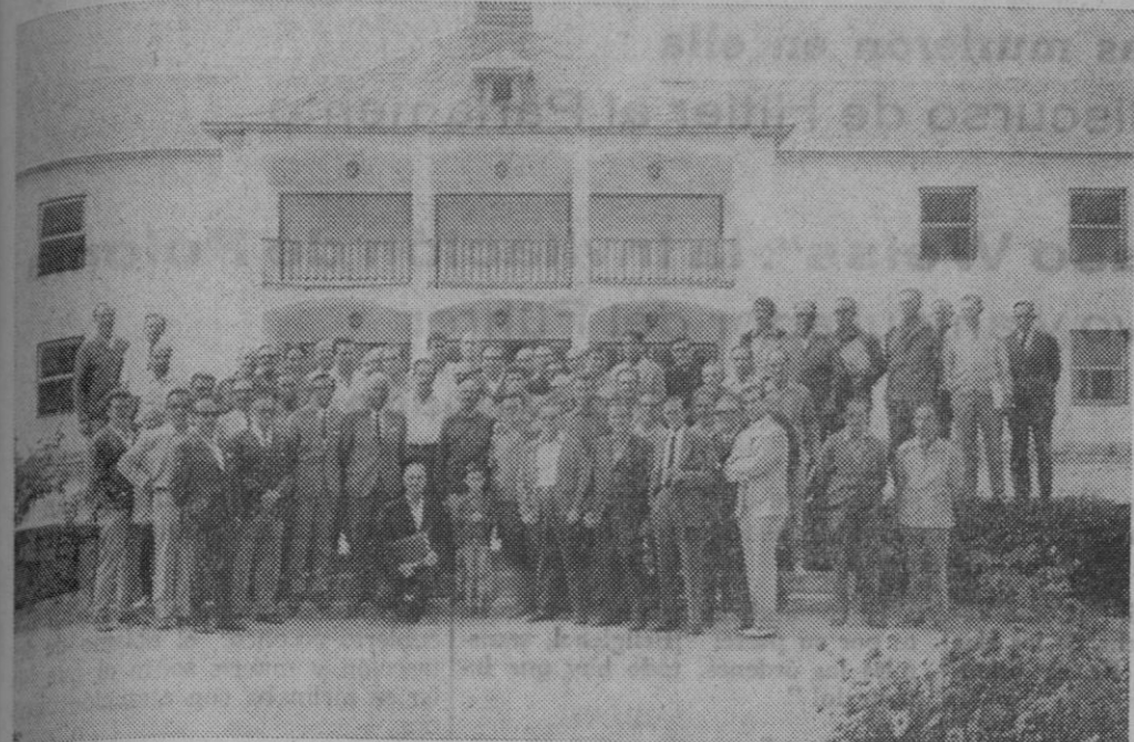
Los trabajadores que han asistido a las jornadas de convivencia, posan junto al secretario general de la Organización Sindical y demás jerarquías.