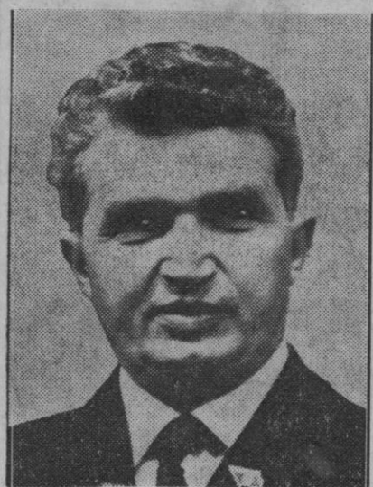
Nicolai Ceausescu, reelegido por unanimidad secretario general del partido comunista rumano y jefe del Gobierno

Barcelona, 1.—La Delegación Provincial del Ministerio de Información y Turismo ha incoado expediente administrativo al semanario «Mundo Internacional». Se ha estimado que, en su número de 9 de agosto último, insertó una información en la que se vierten frases y afirmaciones que pueden suponer infracción de la vigente ley de prensa e impreso en lo que al debido respecto a la verdad se refiere. «Mundo» afirmaba que se ha atribuido al señor López Rodó la dirección de una maniobra «para atraer a la Zarzuela las viejas adhesiones políticas a las posibilidades democráticas que representaba la opción de «Villa Giralda», «quiere decirse que se intenta la colaboración de la llamada oposición». Según el semanario «se han intentado gestiones cerca de Ruiz Jiménez, entre otros».—Cifra.