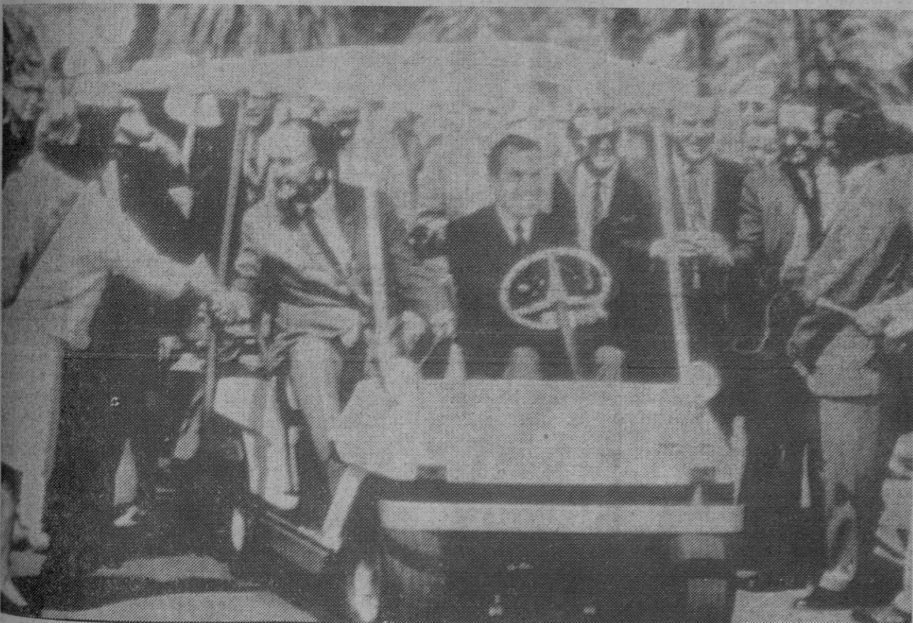
San Clemente de California.—El presidente Nixon conduce un pequeño vehículo en el que le acompaña el ex-presidente Johnson en su camino hacia el helicóptero que los trasladará a la Casa Blanca de verano del presidente.

A las doce de la mañana, doña Carmen Polo de Franco y las personas que la acompañaban continuaron viaje en dirección a Pontevedra.—Cifra.