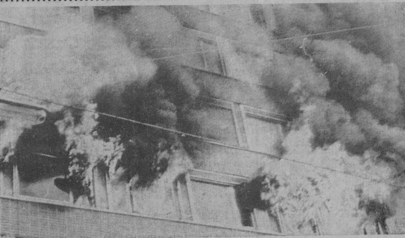
Viena.—Las llamas surgen por las ventanas del edificio donde se encuentran las Embajadas de Canadá y de Suecia en Viena, tras el atentado de que ambas han sido objeto.

un mes en cada caso. Se especifican seguidamente las características exigidas de estas patatas, y después se indica que el F. O. R. P. P. A. pondrá a disposición de la C. A. T. los medios financieros necesarios para la realización de las medidas iniciales, hasta un límite máximo total de 175 millones de pesetas. Los gastos de almacenamiento y manipulación posteriores correspondientes de las patatas adquiridas serán con cargo a la operación y dentro del límite antes señalado.—Cifra.