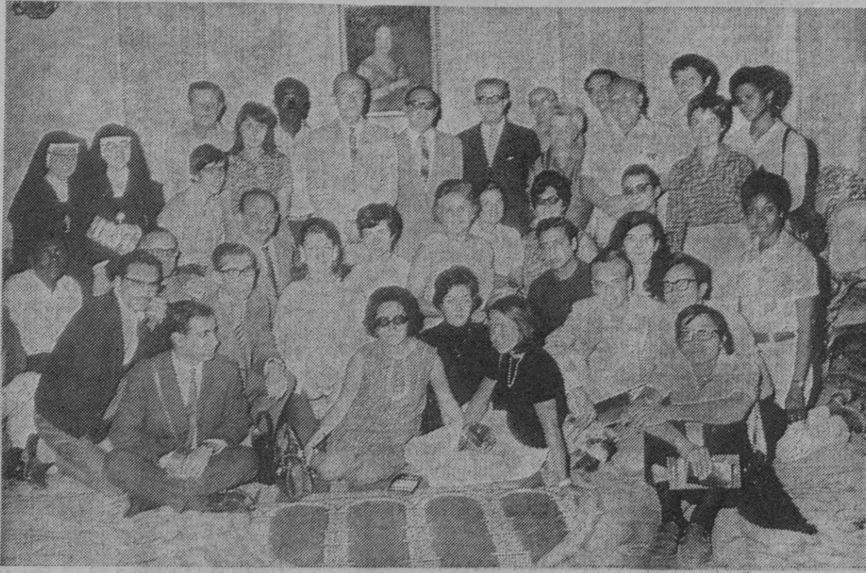
Alumnos extranjeros de la Escuela Oficial de Idiomas, de Madrid, acompañados de algunos profesores, han efectuado hoy una visita turística a nuestra ciudad. En el Ayuntamiento—según informamos en la sección de local—fueron recibidos por el primer teniente de alcalde, junto al que aparecen en la fotografía.

El portavoz militar jordano comunicó más tarde que dos civiles resultaron heridos en la incursión y varias mieses destruidas.—Efe-Reuters.