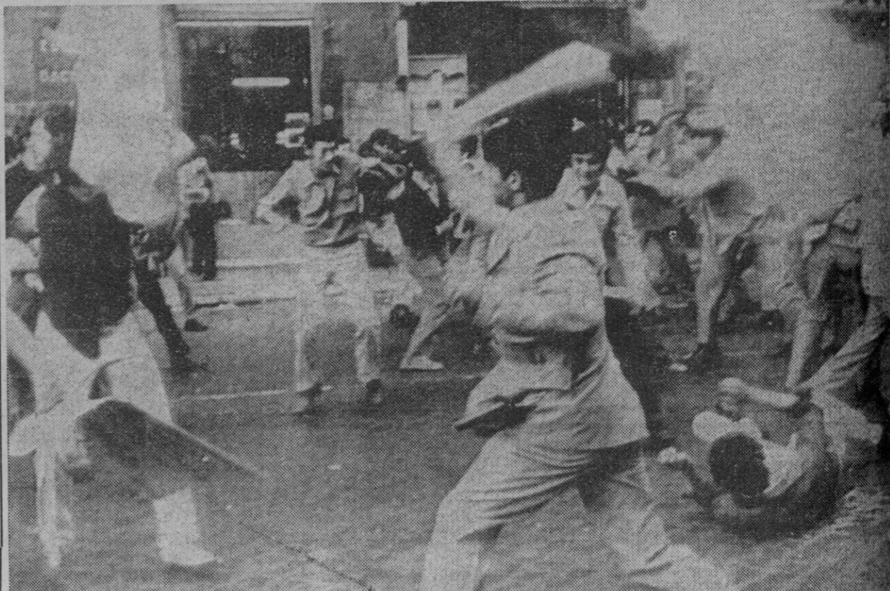
Roma.—Cerca de dos mil neosocialistas han promovido una marcha a lo largo de las calles de la ciudad en señal de protesta contra el régimen de opresión soviético en país checo. La Policía trató de disolver la manifestación y se produjeron algunos heridos en estos choques.

Nuestro deber como segovianos es contribuir, en la medida de nuestras posibilidades, a sufragar las obras en el Santuario de la Fuencisla.