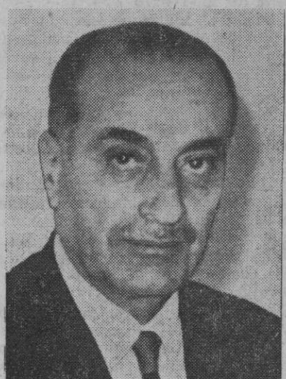
Bajhat Al-Talhami, nuevo jefe del Gobierno jordano

Después del ataque emprendieron la fuga. Los ocupantes del autobús, otros completamente desnudos, debieron recorrer a pie cuatro kilómetros para regresar a esta ciudad, donde fueron atendidos y alojados en un cuartel militar.—Efe.