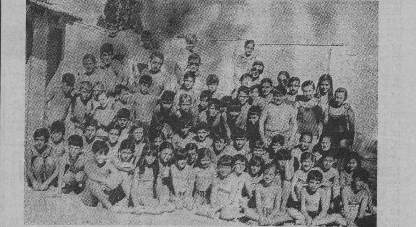
En la Piscina «Florida» se ha clausurado esta mañana el cursillo de natación infantil que había organizado el Club Náutico Segoviano. En la fotografía, los jóvenes alumnos posan junto a sus monitores.

Málaga, 27.—El primer encuentro del Campeonato Nacional de Liga que iba a celebrarse el día 14 de septiembre próximo en el estadio de La Rosaleda, entre los equipos Málaga y Calvo Sotelo, ha sido adelantado al día 13 por la noche, del mismo mes. Tras llegar a un acuerdo con el equipo de Puertollano, se ha comunicado la decisión a la Federación Española de Fútbol.—Alfil.