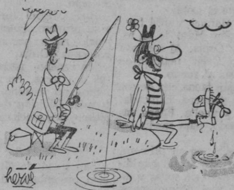
Vaya... ya pican...

Antes de comprar su FRIGORIFICO, vea un Westinghouse en Casa Solera