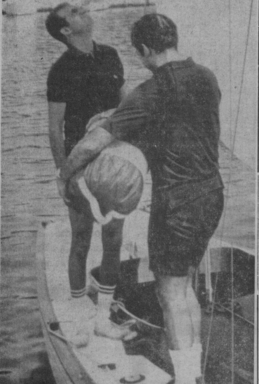
Palma de Mallorca.—El príncipe don Juan Carlos de Borbón, a bordo del yate «Fortuna», se está entrenando con vistas a su participación en una de las jases del Campeonato del Mundo.—(Telefoto Europa Press)

ro de 1953, permitió lograr un suministro continuado y suficiente de energía eléctrica. La experiencia adquirida en su largo periodo de vigencia aconseja modificarlo, adoptando la forma de tarifa «binomia», constituida por un término de potencia,