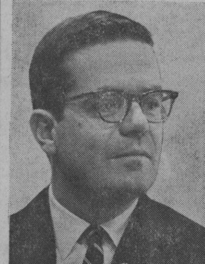
Theodore S. Sorensen, que fue el más próximo colaborador del presidente Kennedy, se presentará como senador demócrata por Nueva York en las elecciones del año que viene