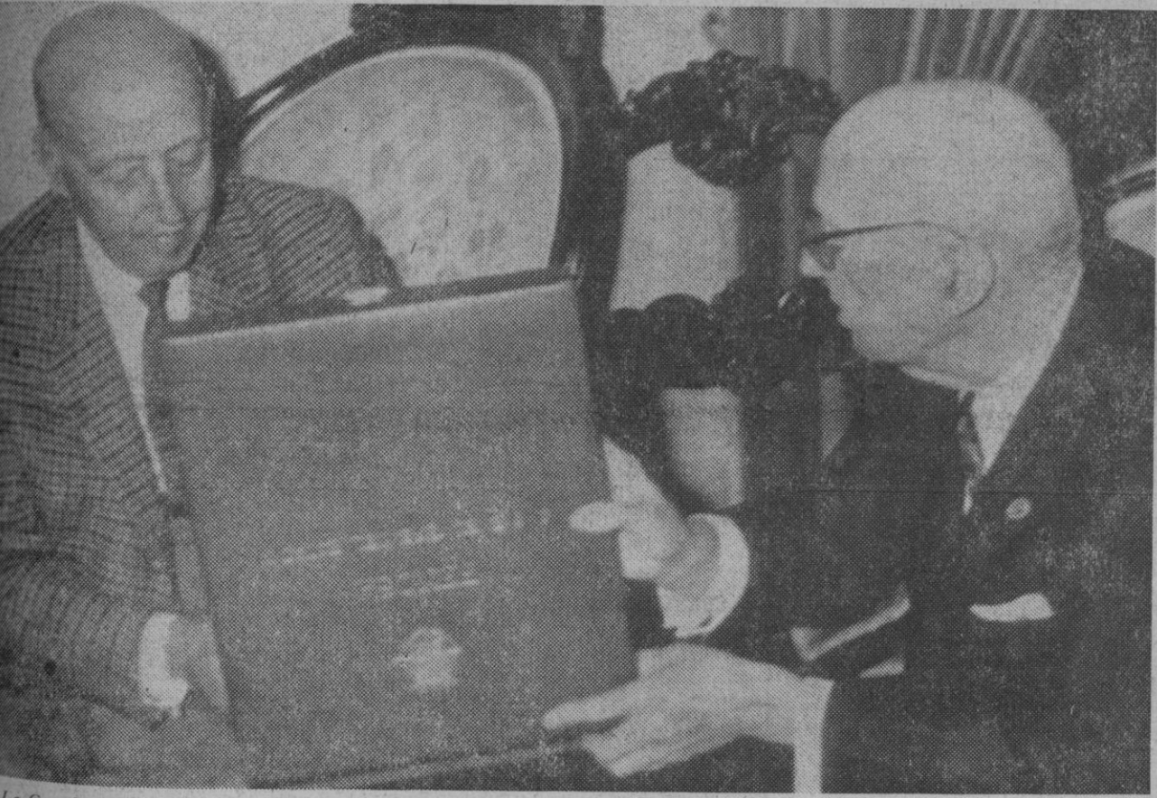
La Coruña.—El Caudillo recibe en audiencia al conde de Fenosa y éste le hace entrega de un álbum con el historial de la empresa que lleva su nombre.—(Telefoto Europa Press)

En tanto se acelera la recolección de las cosechas de verano, los campesinos y cuadros revolucionarios redoblan sus esfuerzos para producir una buena cosecha de otoño, según indica la agencia.—Efe-Reuter.